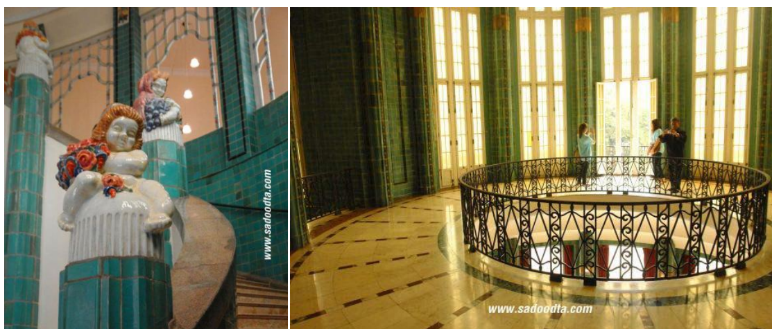
ภาพที่ 25 บันไดวนและโถงชั้นบน