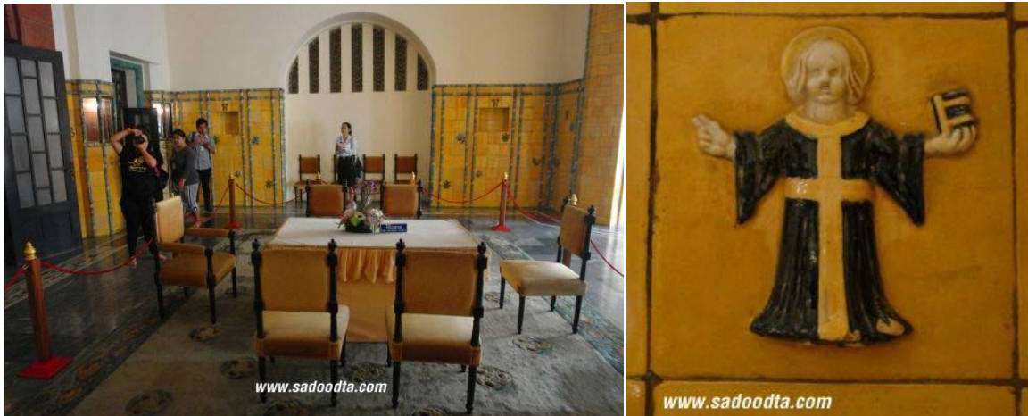
ภาพที่ 26 ห้องเสวยและกระเบื้องรูปนักบุญ