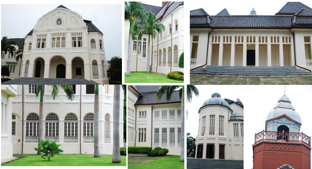
ภาพที่ 7 ทรรศนียภาพทั้งสี่ด้านและรายละเอียดต่างๆของสถาปัตยกรรมพระรามราชนิเวศน์

พระรามราชนิเวศน์ออกแบบโดยสถาปนิกชาวเยอรมันที่ได้เข้ามารับใช้พระบาทสมเด็จพระจุลจอมเกล้าเจ้าอยู่หัวออกแบบพระตำหนักมากมาย เช่น วังบางขุนพรหม ฯ นามว่า นายคาร์ล ดอห์ริง (Karl Dohring) แนวคิดในการออกแบบพระรามราชนิเวศน์ได้นำรูปแบบของพระราชวังของพระเจ้าไกเซอร์แห่งเยอรมัน จำลองย่อขนาดมาใช้เพื่อกำหนดรูปแบบทางสถาปัตยกรรม ลักษณะการออกแบบสถาปัตยกรรมภายนอกเป็นอาคารก่ออิฐรูปน จัดวางองค์ประกอบทางสถาปัตยกรรมด้านแต่ละด้านไม่เท่ากัน (Asymmetry) มีจั้วหลังคาทรงสูง แต่เดิมใช้โครงหลังคาเป็นไม้แต่ภายหลังจากที่มีการบูรณะพระราชวังได้เปลี่ยนจากโครงหลังคาไม้เป็นเหล็กแทน เพื่อความคงทนแข็งแรง มุงหลังคาด้วยกระเบื้องเคลือบดินเผาสีน้ำตาลเข้ม การออกแบบช่องแสง หน้าต่าง ชุ่มประตู่ ใช้ทั้งแบบชุ่มโค้ง และแบบสี่เหลี่ยมทรงสูง สลับกันไปในตำแหน่งต่างๆ ทำให้อาคารแลดูสูงสง่า โปร่งโล่ง มีสัดส่วนที่สวยงาม