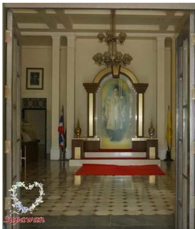
ภาพที่ 9 บริเวณโถงทางเข้า