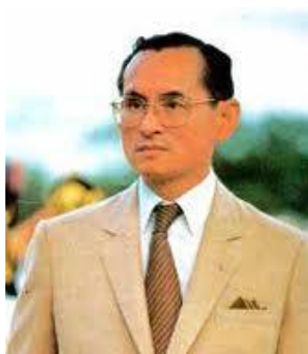
ภาพที่ 5 พระบาทสมเด็จพระเจ้าอยู่หัวภูมิพลอดุลยเดช

ในสมัยรัชกาลที่ ๙ นั้น พระรามราชนิเวศน์ยังคงใช้ถูกใช้งานในราชการทางทหาร ภายหลังได้มีการปรับปรุง บูรณะสิ่งปลูกสร้าง รวมถึงสาธารณูปโภคต่างๆ สร้างที่พัก อาคารต่างๆ รั้ว รวมถึงตกแต่งภูมิทัศน์