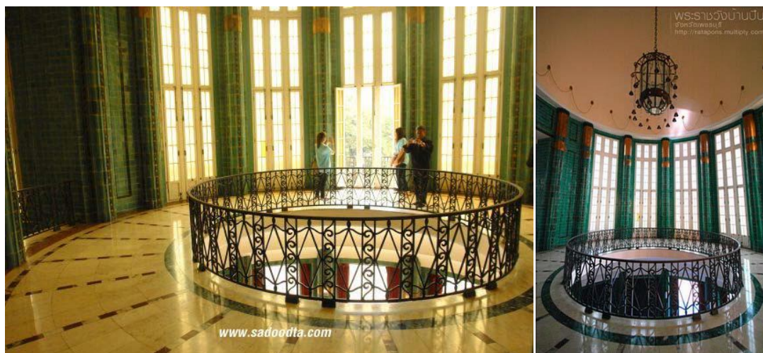
ภาพที่ 14 โถงชั้นบน