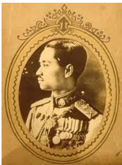
ภาพที่ 3 พระบาทสมเด็จพระปกเกล้าเจ้าอยู่หัว

ในรัชสมัยของพระบาทสมเด็จพระปกเกล้าเจ้าอยู่หัวนั้น พระรามราชนิเวศน์ได้กลับคืนสู่สภาพการ ใช้งานอีกครั้ง โดยมีพระราชประสงค์โปรดเกล้าให้กระทรวงศึกษาธิการนำมาใช้ประโยชน์เพื่อการศึกษา ของชาติ ดังนี้