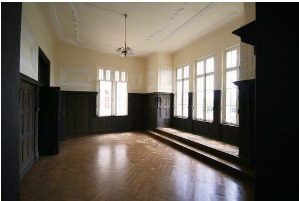
ภาพที่ 17 ห้องบรรทมพระราชินีและห้องบรรทมพระโอรส พระธิดา