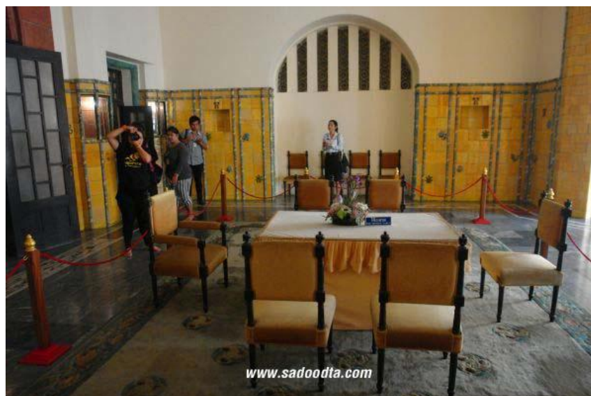
ภาพที่ 12 ห้องเสวยพระกระยาหาร

บริเวณฝ้าเพดานตกแต่งด้วยไม้ต่างระดับด้วยรูปแบบทันสมัย ประตูและหน้าต่างในห้องโถงใหญ่ใช้สีน้ำตาลเม็ดมะขาม แลดูโดดเด่นตัดสลับกับสีขาวครีมของกำแพง เพดาน