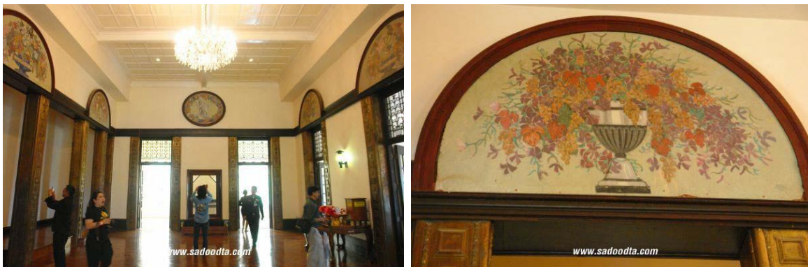
ภาพที่ 30 ห้องบรรทมพระเจ้าอยู่หัวและภาพเขียนแจกันดอกไม้

การประดับตกแต่งห้องด้วยภาพวาดพบเพียงแห่งเดียวในห้องบรรทมพระเจ้าอยู่หัว เนื้อหาของภาพวาดเป็นภาพถาดดอกไม้หลากสีใช้เทคนิคทางศิลปะที่เรียกว่าด้วยสีแบบพาสเทล (Pastel) ติดตั้งประดับอยู่บริเวณซุ้มโค้งเหนือเสาหุ้มทองแดงดูน่าย มีทั้งแบบครึ่งวงกลมและแบบวงรี การตกแต่งภายในพระรามราชนิเวศน์โดยรวมนั้นยังคงใช้แนวคิด แบบอาร์ตนูโว คือ การใช้ลักษณะเด่นจากเส้นสายธรรมชาติ มาสร้างงานออกแบบ มีการผสมผสานวัสดุที่หลากหลาย เช่น เหล็กดัด กระจกสี ไม้ และโลหะ มีความแตกต่างกับต้นกำเนิดของงานแบบอาร์ตนูโวจากเมืองบรัสเซล (Brussel) ประเทศเบลเยียม (Belgium)