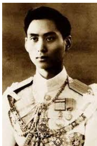
ภาพที่ 4 พระบาทสมเด็จพระอานันทมหิดล

ในรัชสมัยของพระองค์นั้นเคยเสด็จมาประทับเป็นการชั่วคราวเมื่อเสด็จแปรพระราชฐานไปยังพระราชวังไกลกังวล ก่อนเสด็จเข้ากรุงเทพมหานคร พ.ศ. ๒๔๘๘ ในช่วงของเหตุการณ์สงครามโลกครั้งที่ ๒ กระทรวงกลาโหมได้ทำหนังสือกราบบังคมทูลขอพระราชทานบรมราชานุญาตเข้าใช้พระรามราชนิเวศน์ และสิ่งปลูกสร้างทั้งหมดเพื่อใช้ในการ ทรงแสดงพระกรุณาโปรดเกล้าฯ พระราชทานพระบรมราชานุญาตเมื่อวันที่ ๒๘ สิงหาคม พ.ศ. ๒๔๘๕ ขอบเขตที่ดินที่ได้รับครั้งแรก ๑๕๔ ไร่ ๑ งาน ๕๒ ตารางวา ครั้งที่ ๒ วันที่ ๒๙ มกราคม พ.ศ. ๒๔๘๕ จำนวน ๑๕๔ ไร่ ๓ งาน ๖๔ ตารางวา ดำเนินการเป็นที่ตั้งของหน่วยมณฑลทหารบกที่ ๕ กองพัน ๔๕ กรมทหารราบที่ ๔๕ และหน่วยงานทางการทหารที่เกี่ยวข้องอีกหลายหน่วย