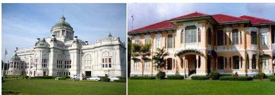
ภาพที่ 18 พระที่นั่งอนันตสมาคม, ตำนกจิตรลดา วังปารุสกวัน

แห่งในประเทศไทย เช่น ตำนกจิตรลดา วังปารุสกวัน พระที่นั่งอนันตสมาคม บ้านนรสิงห์ ฯ และทรงประทับที่เมืองฟลอเรนซ์ เพื่อหาผู้เชี่ยวชาญในศิลปะแขนงต่างๆ ในเมืองนี้ เมืองต้นกำเนิดของศิลปะแบบฟื้นฟูวิทยาการ (Italian Renaissance) ที่มีคุณค่าและอิทธิพลทางศิลปะต่อชาติอื่นๆทั่วโลก ทรงพระราชทานวโรกาสให้ช่างเขียนชาวอิตาเลียนเขียนพระบรมฉายาลักษณ์พระองค์ถวาย (รูปภาพสีน้ำมัน) และนำพาจิตรกร ประติมากร มากฝีมือเข้ามาทำงานรับใช้พระองค์และพระบรมวงศานุวงศ์ภายในประเทศไทย เช่น นายริโกลี นายกาลิเลโอ คินี นายเฟโรซี หรือท่านศาสตราจารย์ศิลป์ พีระศรี ฯ ในรัชสมัยนี้เป็นช่วงหนึ่งที่ได้มีการก่อสร้างพระราชวัง พระราชสถาน ศาสนสถานและสถานที่ราชการเป็นจำนวนมาก มีช่างชาวตะวันตกหลายชาติที่ได้เข้ามามีบทบาทสำคัญในแวดวงสถาปัตยกรรมและการออกแบบของสยาม