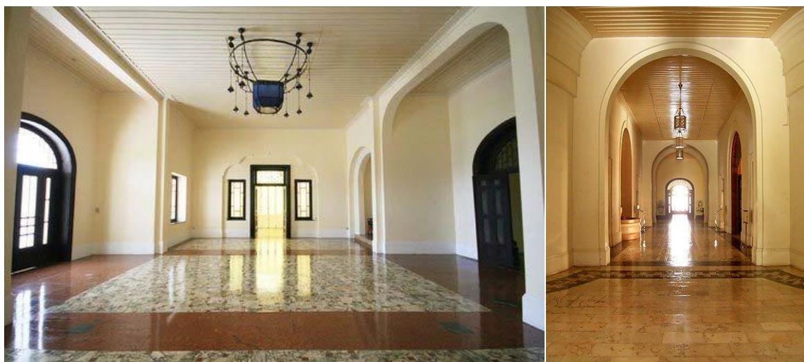
ภาพที่ 11 ห้องโถงใหญ่และบริเวณทางเชื่อม

พื้นที่เชื่อมต่อระหว่างโถงทางเข้ากับห้องโถงใหญ่ โดดเด่นด้วยซุ้มประตูสีขาวสูงสง่า วางเรียงกันอย่างเป็นจังหวะ ประดับด้วยกระจกลายน้ำ พบว่ากระจกบางแห่งได้ชำรุดและมีการเปลี่ยนใหม่เป็นกระจก ลวดลายดอกพิกุล พื้นปูด้วยหินอ่อนสีงาช้าง สภาพปัจจุบันใช้เป็นส่วนประกอบของพื้นที่จัดนิทรรศการใน พระราชวัง