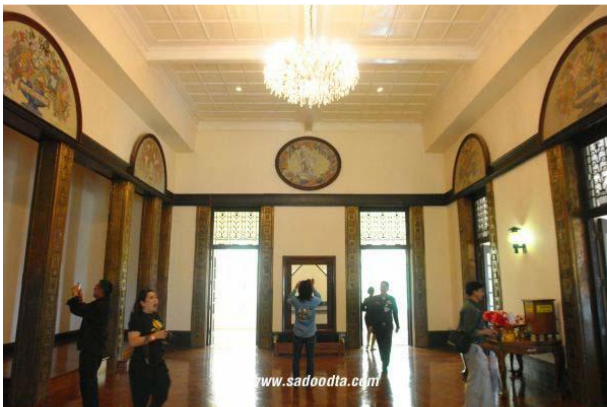
ภาพที่ 16 ห้องบรรทมพระเจ้าอยู่หัว