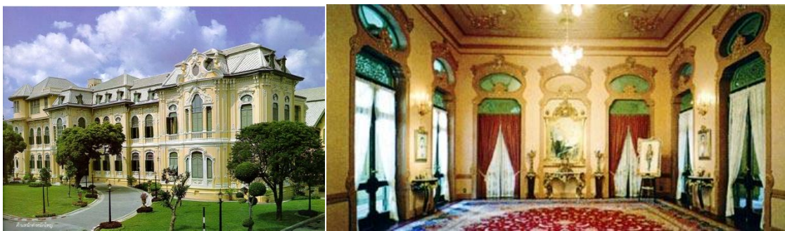
ภาพที่ 21 วังบางขุนพรหม

ชาวตะวันตกที่เข้ามาทำงานสถาปัตยกรรมและศิลปะออกแบบ ในกรุงรัตนโกสินทร์ในขณะนั้นมีมากมายหลากหลายเชื้อชาติ เช่น อังกฤษ ฝรั่งเศส เยอรมัน อิตาลี แต่จากวิเคราะห์จากผลงานที่ปรากฏ ประกอบกับหลักฐานทางประวัติศาสตร์ การเลือกใช้ช่างชาวตะวันตกของพระบาทสมเด็จพระจุลจอมเกล้าเจ้าอยู่หัว เพื่อทำงานสนองพระองค์ในการก่อสร้างพระตำหนัก พระราชวัง ที่สำคัญในการใช้เพื่อประทับนั้นมีเพียง ๒ ชาติ คือเยอรมัน และอิตาลี ด้วยเหตุที่ทั้งสองชาติที่กล่าวมานั้นได้มีความสัมพันธ์กับประเทศไทยในเชิงสร้างสรรค์ ไม่มีส่วนเกี่ยวข้องกับการล่าอาณานิคมอย่างเช่นประเทศที่กล่าวมา จึงไม่เป็นที่น่าแปลกใจที่จะได้รับความไว้วางพระราชหฤทัยให้ดำเนินการออกแบบและก่อสร้างพระราชวังที่สำคัญหลายแห่ง ในที่นี้จะกล่าวถึงชาวเยอรมันที่เข้ามาทำงานรับใช้ราชวงศ์จักรี ที่มีบทบาทมากที่สุด คือ นายคาร์ล ดอห์ริง ที่ได้ออกแบบวังบางขุนพรหม ที่ได้นำสถาปัตยกรรมแบบบาโรค และการตกแต่งแบบโรโคโคไชของเยอรมันมาใช้ในการออกแบบพระตำหนักต่างๆ โดยภายในได้มีช่างชาวอิตาเลียนจำนวนหนึ่งทำการออกแบบและเขียนรูปจิตรกรรมฝาผนังด้วยศิลปะแบบอาร์ตนูโว (Art Nouveau) ซึ่งเป็นรูปแบบของศิลปะที่ได้รับความนิยมในชาติตะวันตก และการสร้างพระราชวังพระรามราชนิเวศน์ จังหวัดเพชรบุรี ยังคงนำรูปแบบของศิลปะแบบอาร์ต นูโว มาใช้ในการออกแบบพระราชวังทั้งด้านสถาปัตยกรรมภายนอกและภายใน