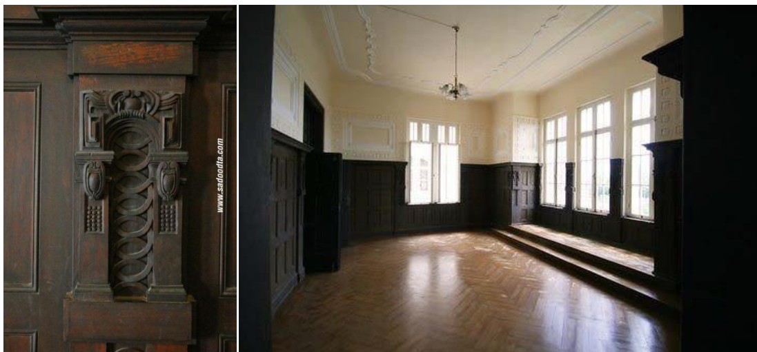
ภาพที่ 28 การตกแต่งผนังด้วยไม้