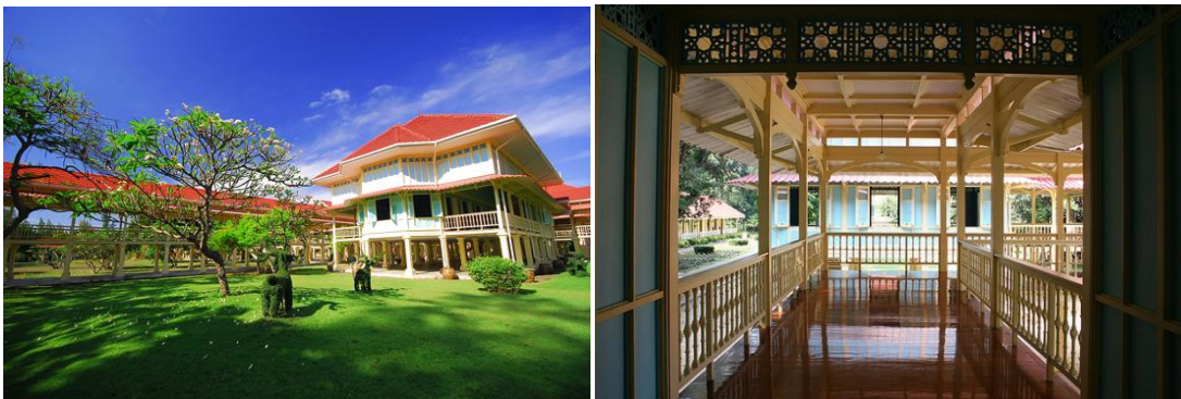
ภาพที่ 20 พระราชนิเวศน์ มฤคทายวัน จังหวัดเพชรบุรี