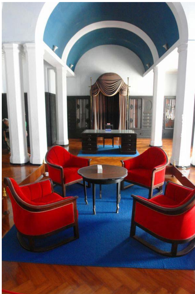
ภาพที่ 15 ห้องทรงพระอักษร