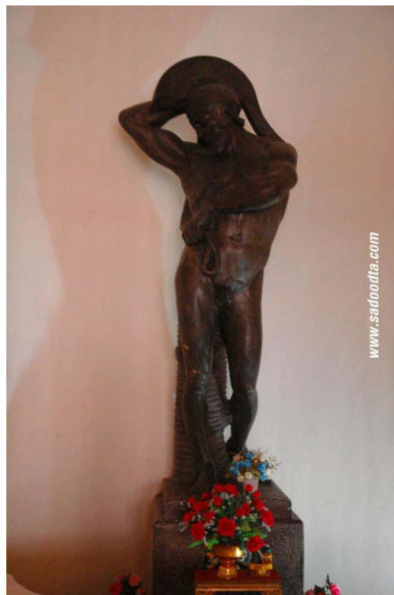
ภาพที่ 27 รูปปั้นเทพเจ้าโพไซดอน

ด้านซ้ายและด้านขวาของห้องมีช่องลมรูปครึ่งวงกลม แบ่งออกเป็นช่องละเท่าๆกัน 7 ช่อง ครอบติดกับเหล็กดัดสีดำเม็ดมะขามรูปเกวาลย์ไม้ ด้านประตูทางเข้ามีเหล็กดัดขนาดใหญ่เป็นรูปม่านเกวาลย์ไม้ดอกไม้ คุยิ่งใหญ่และสวยงามมาก เมื่อเปิดออกไปจะเห็นรูปหล่อบรอนซ์ของเทพโพไซดอน (Poseidon) เทพเจ้าผู้ปกครองท้องทะเลขนาดใหญ่ประดับอยู่ด้านนอกบริเวณโถงทางเดิน ส่งเสริมภาพลักษณ์ให้ห้องเสวยดูยิ่งใหญ่ และสง่างาม ในทางจิตวิทยาการตั้งรูปปั้นเทพเจ้าไว้ด้านหลังแสดงถึงพระราชอำนาจขององค์พระเจ้าอยู่หัว เปรียบเสมือนเป็นราชาของท้องทะเลและสรรพสิ่ง