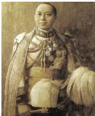
ภาพที่ 2 พระบาทสมเด็จพระมงกุฎเกล้าเจ้าอยู่หัว

พระบาทสมเด็จพระมงกุฎเกล้าเจ้าอยู่หัวทรงมีสำเนาพระบรมราชโองการลงวันที่ ๗ พฤษภาคม พ.ศ. ๒๔๖๑ ให้พระราชทานนามนามพระราชวังบ้านปืนใหม่ว่า “พระรามราชาธิเบศร์” และพระราชทานนามพระที่นั่งว่า “ศรเพชรปราสาท” ได้กระทำพิธีขึ้นพระตำหนักใหม่ในวันที่ ๑๓ มิถุนายน พ.ศ. ๒๔๖๑ ซึ่งในสมัยของพระองค์นั้นได้เสด็จมาประทับ ๙ ครั้ง ในปี พ.ศ. ๒๔๕๘ ทรงมีพระราชดำริพระราชทานพระรามราชาธิเบศร์ให้เป็นที่ว่าการเมืองเพชรบุรี โดยได้มีการสรุปค่าใช้จ่ายในการก่อสร้างเพื่อใช้เป็นข้อมูลเงินชดใช้พระคลังข้างที่หอรัษฎากรพิพัฒน์ ดังนี้ ๑. ค่าก่อสร้างพระตำหนัก ๕๕๙,๖๗๗.๐๙ บาท ๒. ค่าเครื่องแต่งเครื่องประดับ ๗๒๙,๘๒๙.๒๙ บาท ๓. ค่าที่ดิน ๒๓,๓๙๔.๔๙ บาท รวมทั้งสิ้น ๑,๓๑๑,๙๐๐.๘๗ บาท