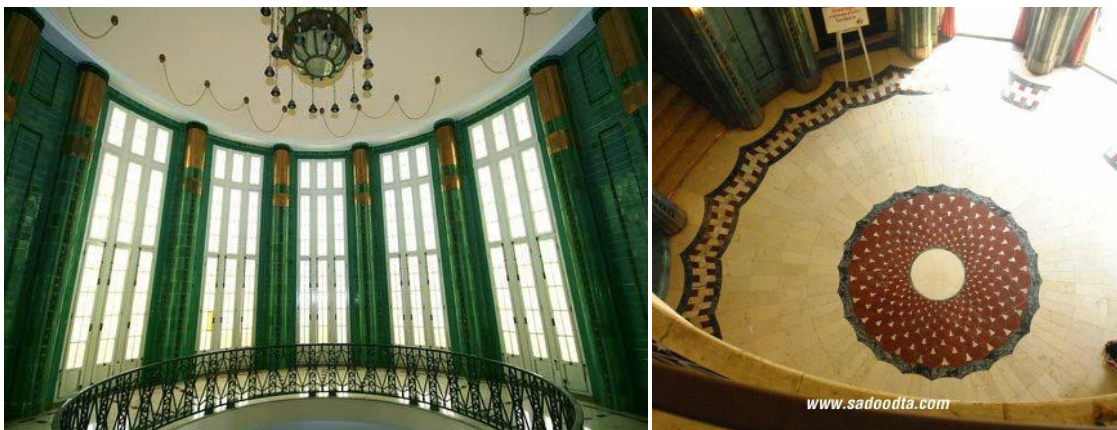
ภาพที่ 24 ห้องโถงชั้นบนและล่าง