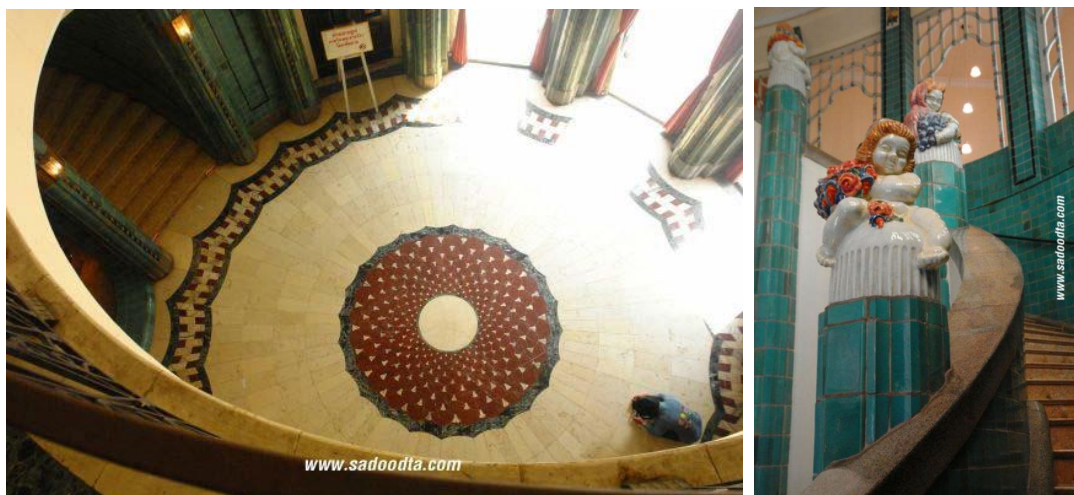
ภาพที่ 13 โถงบันไดชั้นล่างและทางขึ้นบันไดวน