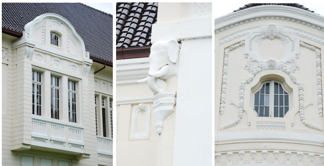
ภาพที่ 8 รายละเอียดลวดลายปูนปั้นในส่วนต่างๆ ของสถาปัตยกรรมภายนอก

ลักษณะการประดับตกแต่งอาคารภายนอกพบมากเป็นการตกแต่งจำพวก ลวดลายปูนปั้นใช้รูปทรงทางธรรมชาติ เช่น เถาวัลย์ไม้ ดอกไม้ ตราสัญลักษณ์ ปูนปั้นรูปสัตว์ใหญ่ประดับประดับอยู่ตำแหน่งที่สำคัญโดยรอบของพระราชวัง จากการสำรวจจึงเน้นการออกแบบตกแต่งส่วนของสถาปัตยกรรมภายนอกเน้นรูปแบบการตกแต่งที่เรียบง่ายทั้งด้านรูปทรงประตู หน้าต่าง ช่องแสง รวมถึงการใช้สี สีของพระราชวังใช้สีครีมขาวเป็นสีหลักตัดสลับกับสีน้ำตาลเข้มของกระเบื้องหลังคา