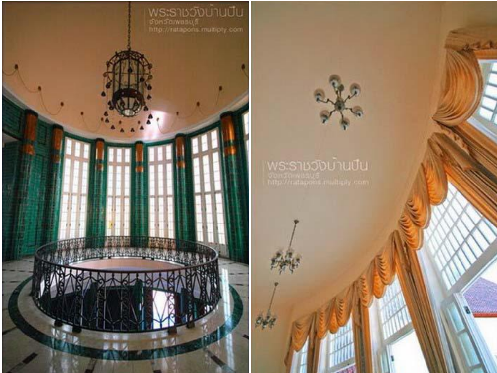
ภาพที่ 29 โคมไฟระย้า โลหะ