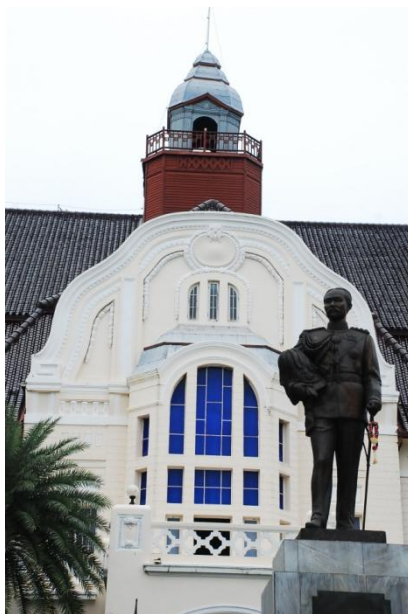
ภาพที่ 1 พระบรมฉายาลักษณ์รัชกาลที่ ๕ คู่กับพระรามราชนิเวศน์ เพชรบุรี

พระรามราชนิเวศน์ หรือนามเดิม เรียกว่า พระราชวังวังบ้านปืน ตั้งอยู่ทางทิศตะวันตกของแม่น้ำเพชรบุรี ตำบลบ้านหม้อ อำเภอเมือง จังหวัดเพชรบุรี มีเนื้อที่ทั้งหมด 349 ไร่ 1 งาน 17 ตารางวา ถูกสร้างขึ้นโดยพระราชประสงค์ของพระบาทสมเด็จพระจุลจอมเกล้าเจ้าอยู่หัวในช่วงตอนปลายของรัชกาล ใช้ในการเสด็จประทับเพื่อรักษาอาการประชวรของพระองค์ พระราชวังบ้านปืนได้เริ่มสร้างและวางรากฐานในเดือน มกราคม พ.ศ. ๒๔๕๓ และพระบาทสมเด็จพระจุลจอมเกล้าเจ้าอยู่หัวเสด็จพระราชดำเนินวางศิลาพระฤกษ์ด้วยพระองค์เองในวันที่ ๑๙ สิงหาคม พ.ศ. ๒๔๕๓ ณ เวลาเช้า ๙ นาฬิกา ๗ นาที ๑๑ วินาที