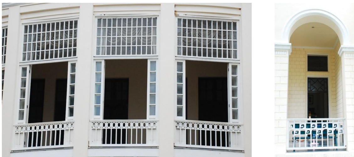
ภาพที่ 23 ลายเหล็กดัดรูปทรงเรขาคณิต