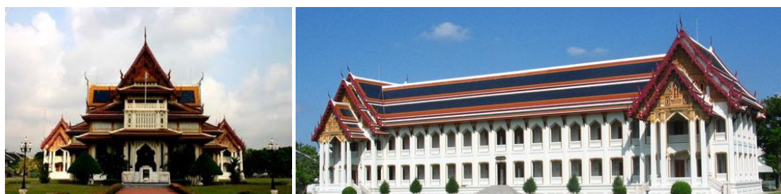
ภาพที่ 19 โรงเรียนวชิราวุธวิทยาลัย

ในรัชสมัยของพระบาทสมเด็จพระมงกุฎเกล้าเจ้าอยู่หัว ทรงมีพระราชดำริที่ต่อเนื่องจากองค์พระบรมราชชนกนาค คือ การพัฒนาประเทศให้มีความทันสมัย แต่ด้วยพื้นฐานและประสบการณ์ของพระองค์ที่ได้รับการศึกษาจากประเทศตะวันตกมาตั้งแต่วัยเยาว์ทำให้ได้เห็นข้อดี และข้อด้อย ความเหมาะสม และความไม่เหมาะสมของการนำเอาวิทยาการมาใช้ รวมถึงด้านสถาปัตยกรรม ทรงมีพระราชดำริให้นำความเป็นไทยเข้ามาประยุกต์ใช้ในการสร้างอาคาร สถาปัตยกรรมต่างๆ บูรณาการระหว่างศิลปะแบบไทย ประเพณีและการออกแบบของชาติตะวันตกทำให้ได้ผลงานรูปแบบใหม่ แสดงถึงอุดมคติของความเป็นไทยแบบประเพณี ที่เรียกว่า ไทยประยุกต์ เช่น การออกแบบสถาปัตยกรรมในโรงเรียนวชิราวุธวิทยาลัย