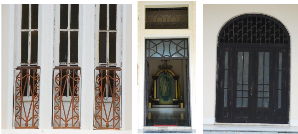
ภาพที่ 22 ลายเหล็กดัดรูปทรงธรรมชาติ

การตกแต่งประตู หน้าต่าง ภายในพระรามราชนิเวศน์ มีความเรียบง่าย วงกบประตูรวมถึงการตกแต่งวงกบใช้ไม้ทำสีน้ำตาลเข้ม ส่วนของช่องลมส่วนใหญ่ใช้เหล็กดัดออกแบบเป็นรูปทรงเรขาคณิตและลวดลายธรรมชาติที่ตัดทอนรายละเอียดของรูปทรงเหลือเพียงรูปทรงบริสุทธิ์ (Pure form) ของสิ่งนั้น แต่ยังคงไว้ซึ่งความอ่อนช้อย สวยงาม ตามแบบศิลปะแบบอาร์ต นูโว (Art Nouveau) หรือ จุงเกินสไตล์ (Jugendstil) เคลือบด้วยสีดำ มีทั้งรูปเกาวัลย์ไม้เลื้อย รูปม่านดอกไม้ รูปใบไม้ รูปสัญลักษณ์ พบว่ามีบางลายเหล็กดัดถูกใช้ประดับอาคารภายนอก