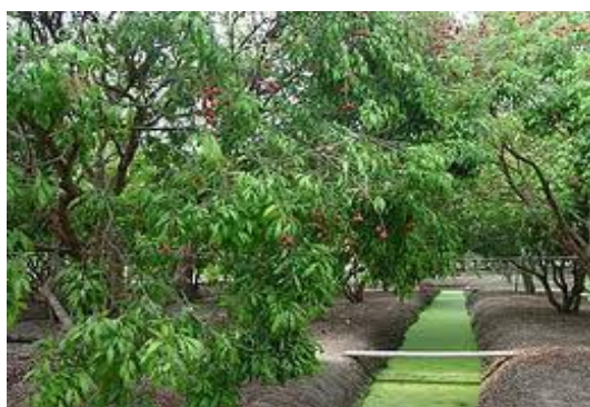
ภาพ 5 อาชีพหลักการปลูกลิ้นจี่