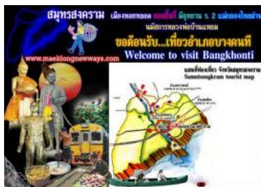
ภาพ 6 ป้ายต้อนรับนักท่องเที่ยว

แนวทางการจัดการสำหรับธุรกิจที่พักในอำเภอบางคนที สมุทรสงคราม ด้วยแนวคิดเศรษฐกิจพอเพียง