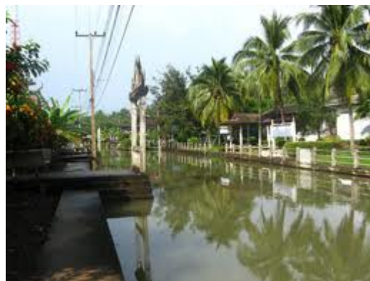
ภาพ 2 วิถีความเป็นอยู่ริมน้ำ