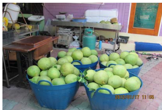
ภาพ 4 สัมโอพันธ์ข้าวใหญ่