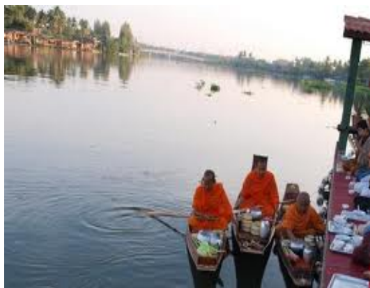
ภาพ 1 ตักบาตรพระยามเช้า