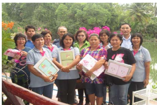
ภาพ 3 ผู้วิจัยกับสมาชิกรักษ์บางคนที่