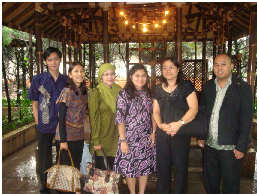
ภาพ 1 คณะอาจารย์ประจำสาขาการจัดการการตลาดการท่องเที่ยว มหาวิทยาลัย UPI