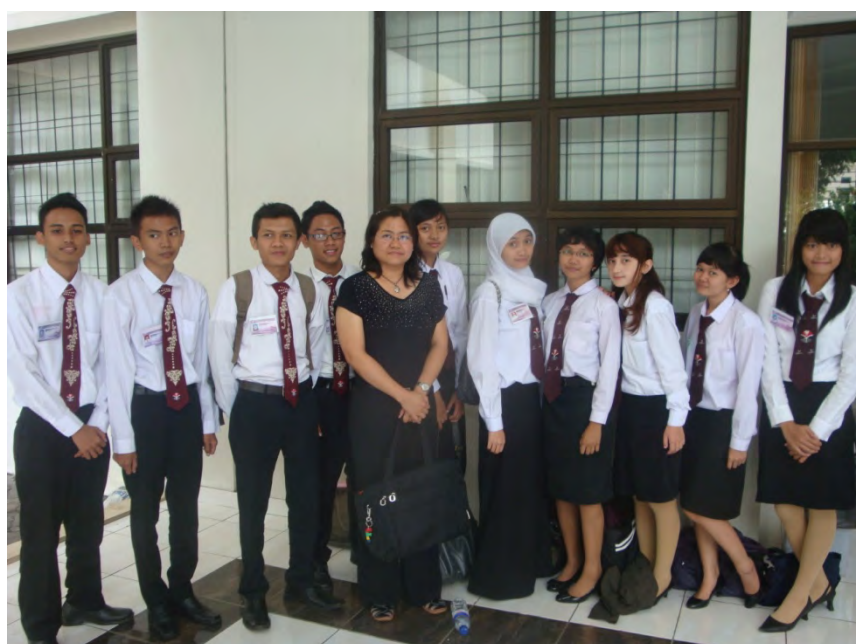
ภาพ 2 นักศึกษาชั้นปีที่ 1 หลักสูตรการจัดการการตลาดการท่องเที่ยว มหาวิทยาลัย UPI