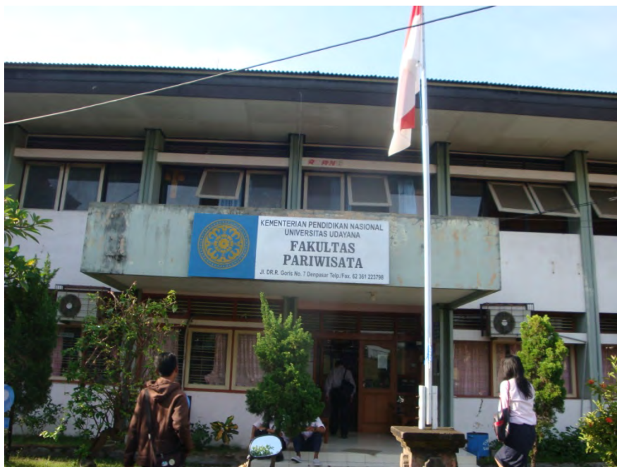
ภาพ 4 บริเวณด้านหน้าคณะท่องเที่ยว มหาวิทยาลัย Udayana