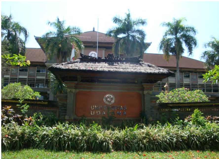
ภาพ 3 บริเวณด้านหน้า มหาวิทยาลัย Udayana, Bali