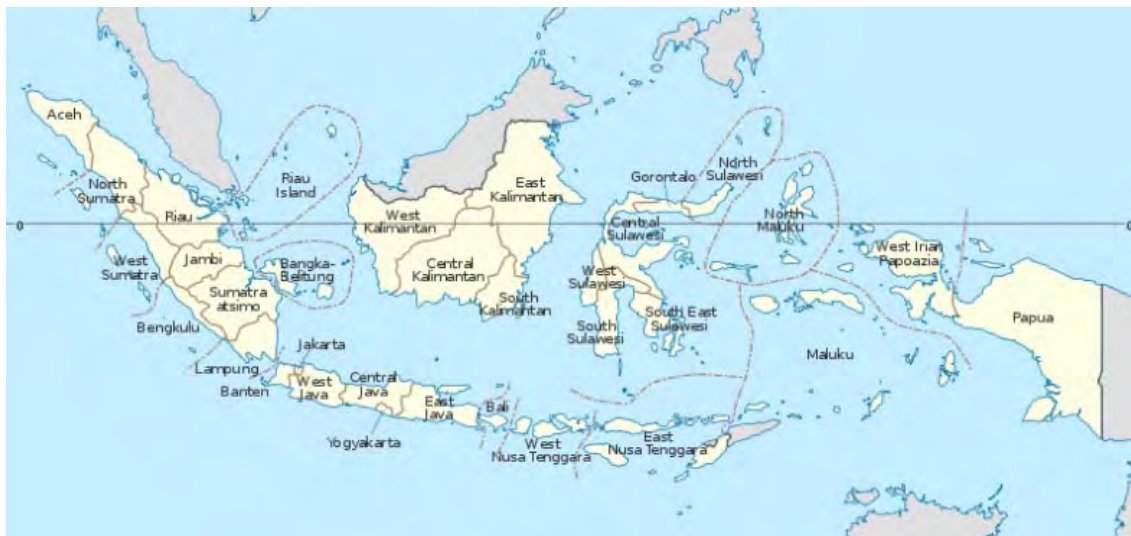
ภาพที่ 2.1 แผนที่ประเทศอินโดนีเซีย