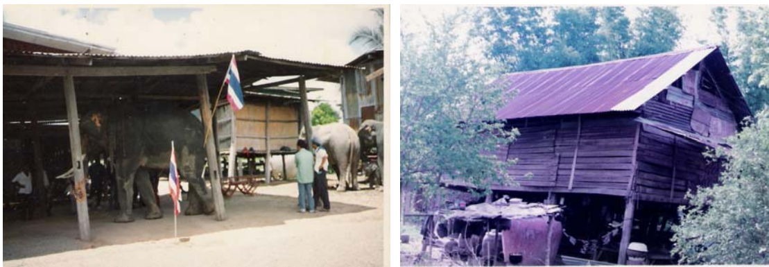
ภาพที่ 4.1 สภาพบ้านเรือนของชาวกวยหรือส่วยหมู่บ้านตากกลาง ตำบลกะโพ อำเภอท่าตูม จังหวัดสุรินทร์