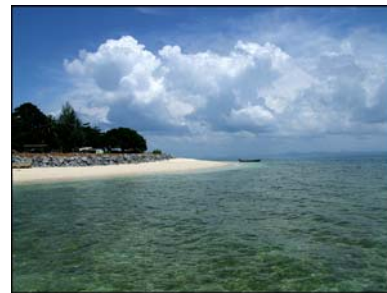
เกาะบุโหลนดอน