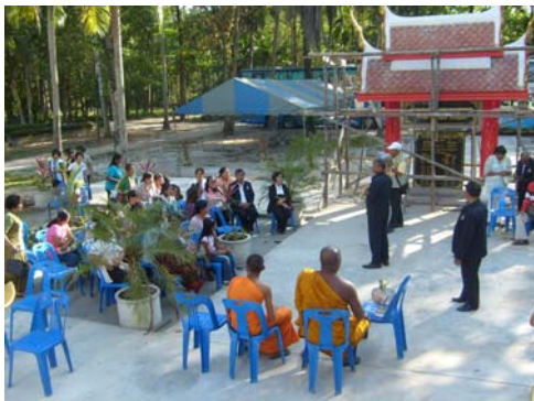
ภาพที่9 ประชุมเวทีชาวบ้าน จ.นครศรีธรรมราช