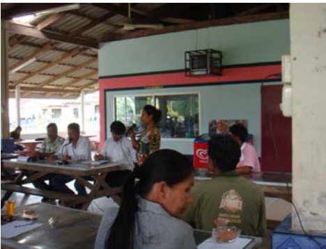
ภาพที่3 ประชุมเวทีชาวบ้าน จังหวัดตรัง