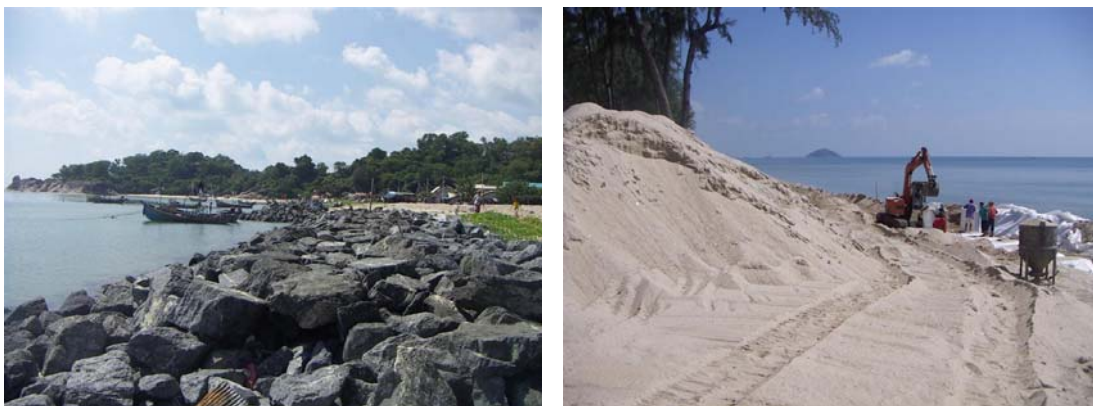
ภาพที่ 3 แสดงการนำหินและทรายมาปรับแต่งบริเวณหาดสมิหลา จังหวัดสงขลา เพื่อป้องกันน้ำทะเลกัดเซาะชายฝั่ง และเพิ่มพื้นที่ชายหาด

สิ่งแวดล้อมในบริเวณนั้น นอกจากนี้ที่หาดสมิหลายังได้มีการนำทรายจากภายนอกมาถมบริเวณชายหาดเพื่อป้องกันการพังทลายของชายหาดในบริเวณนั้นด้วย