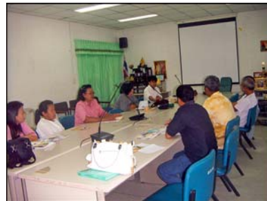
การประชุมเวทีชาวบ้าน