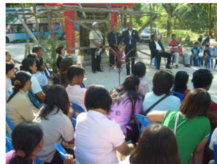
ภาพที่10 ประชุมเวทีชาวบ้านจ.นครศรีธรรมราช