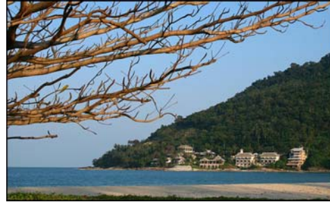
อ่าวขนอม