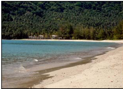
หาดโนพะลา