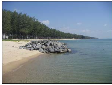
แหลมสมิหลา