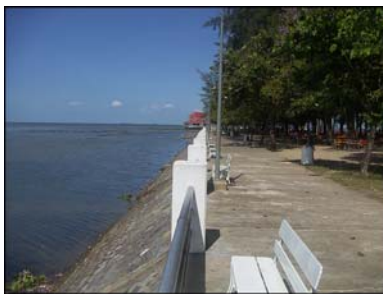
หาดแสนสุขลำปำ