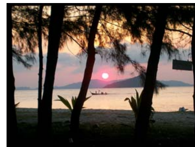
เกาะบุโหลนเล