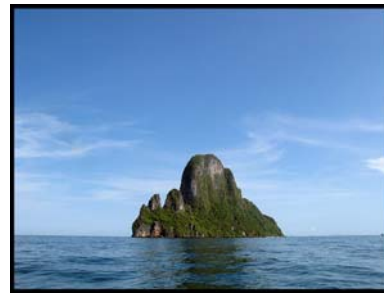
เกาะตะเกียง