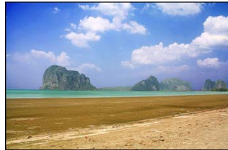
หาดปากเมง