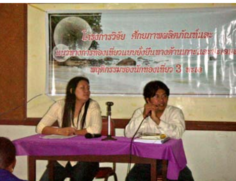
ภาพที่5 ประชุมเวทีชาวบ้าน จังหวัดสตูล