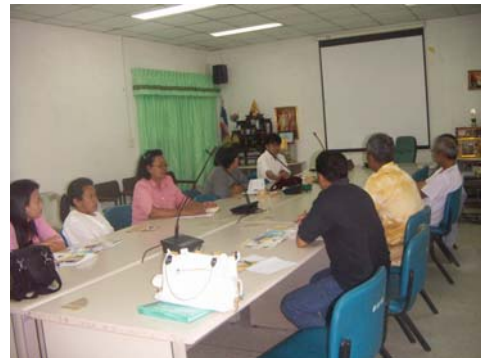
ภาพที่4 ประชุมเวทีชาวบ้าน จังหวัดสงขลา