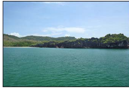
เกาะตะรุเตา