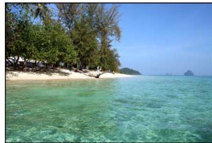
เกาะกระดาน