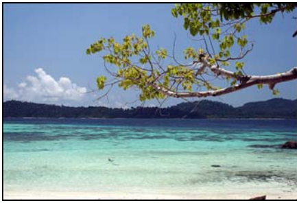
เกาะอาดัง