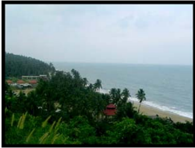
เขาพลายดำ