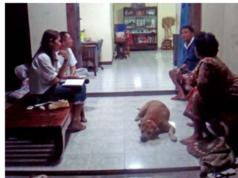
ภาพที่6 สัมภาษณ์ชาวบ้าน จังหวัด นครศรีธรรมราช