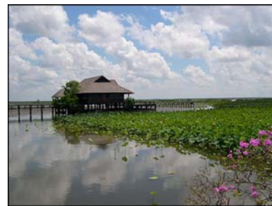
อุทยานนกน้ำทะเลน้อย