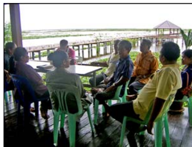
การประชุมเวทีชาวบ้าน