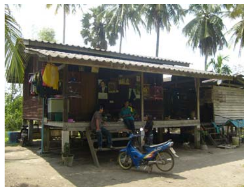
ภาพที่ 12 การสัมภาษณ์ชาวบ้าน จ.ตรัง