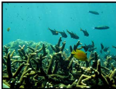
จุดดำน้ำบริเวณเกาะตะเกียง