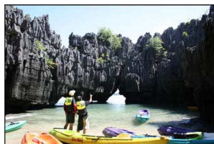
ปราสาทหินเขาพันยอด