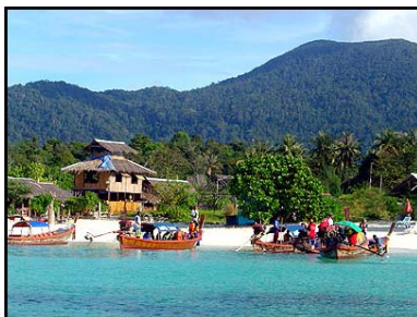
เกาะหลีเป๊ะ