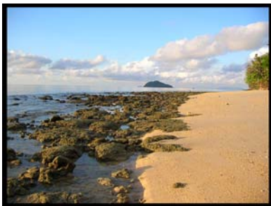
เกาะเกตุรา