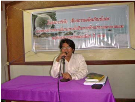
ภาพที่1 ประชุมเวทีชาวบ้าน จังหวัดพัทลุง