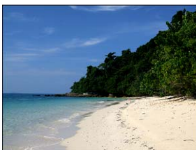
เกาะบุโหลนไม้ไผ่