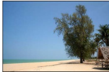
แหลมตะดุมฟูก