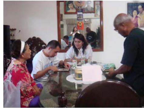
ภาพที่8 ประชุมเวทีชาวบ้าน จังหวัด นครศรีธรรมราช