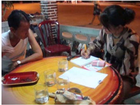
ภาพที่7 สัมภาษณ์ชาวบ้าน จังหวัดตรัง