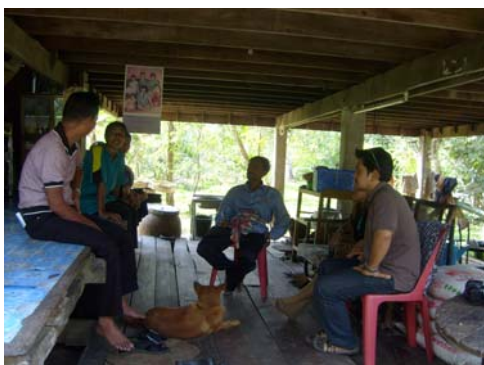
ภาพที่ 11 การสัมภาษณ์ชาวบ้าน จ.ตรัง