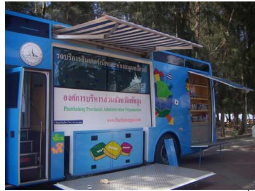
ภาพที่ 4 การจัดกิจกรรมเพิ่มเติมบริเวณหาดสมิหลา (สงขลา) และหาดแสนสุขลำปำ (พัทลุง) เพื่อดึงดูดนักท่องเที่ยว

2.8 ด้านการมีส่วนร่วมของชุมชน ได้แก่ โอกาสของชุมชนในการเข้าร่วมดำเนินการและตัดสินใจเกี่ยวกับการจัดการท่องเที่ยว การมีส่วนร่วมของชุมชนในการได้รับผลประโยชน์จากแหล่งท่องเที่ยว ความเป็นมิตรจากคนในชุมชน เป็นต้น