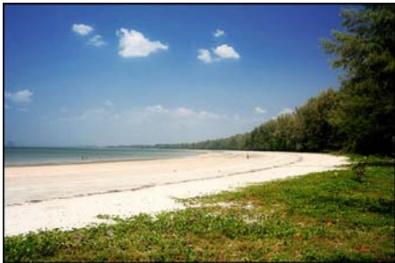
หาดเจ้าไหม