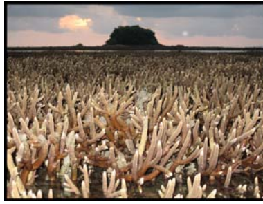
แหล่งปะการังบริเวณเกาะลิตี