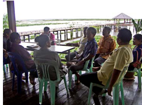
ภาพที่2 ประชุมเวทีชาวบ้าน จังหวัดพัทลุง