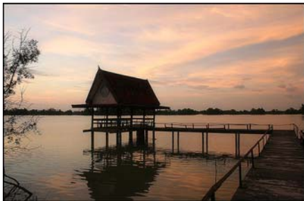
อุทยานนกน้ำคูชูด