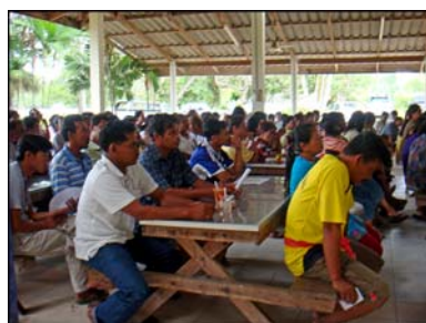
การประชุมเวทีชาวบ้าน