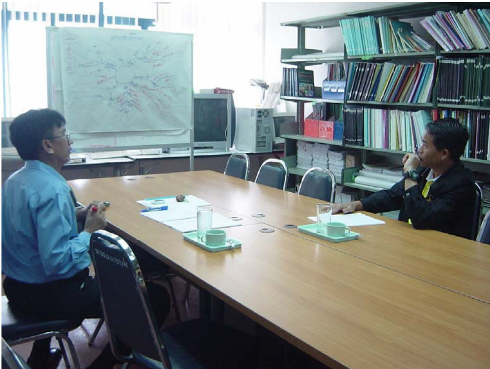
ภาพกิจกรรมการเก็บข้อมูลเกี่ยวกับแนวทางการพัฒนาแหล่งท่องเที่ยวระหว่างนักวิจัยและเจ้าหน้าที่จากวนอุทยานเขากระโดง