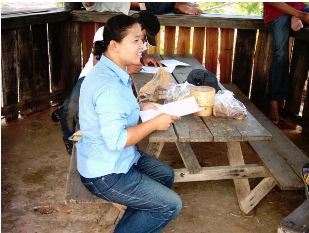
ภาพกิจกรรมการเก็บข้อมูลโดยใช้แบบสอบถามจากนักท่องเที่ยว ณ อุทยานแห่งชาติผาแต้ม จ. อุบลราชธานี