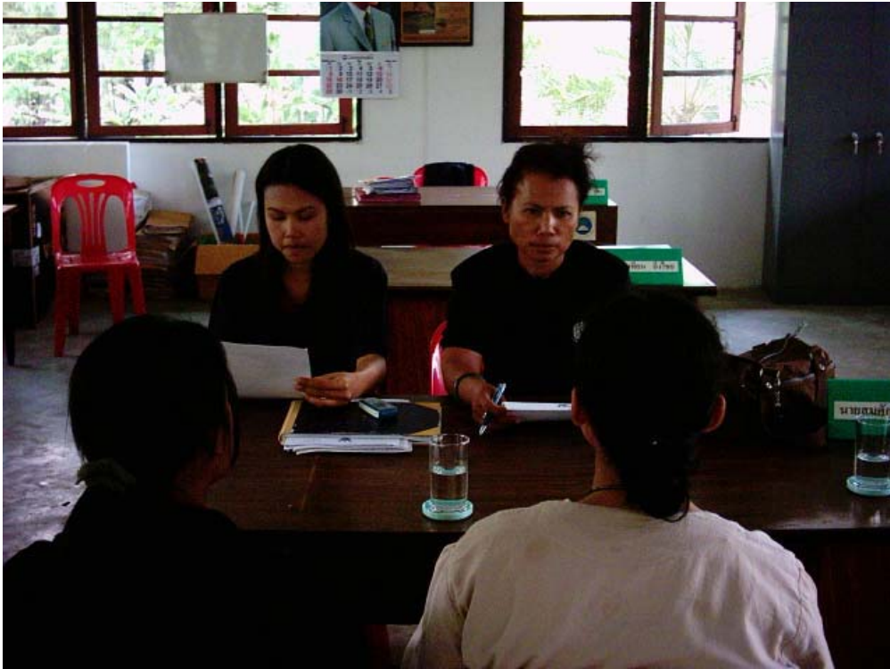
ภาพกิจกรรมการสัมภาษณ์พูดคุยร่วมกับเจ้าหน้าที่วนอุทยานพนมสวาย