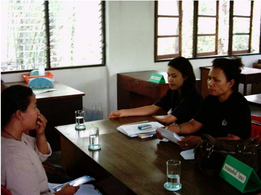
การสัมภาษณ์พูดคุยกับเจ้าหน้าที่วนอุทยานพนมสวาย