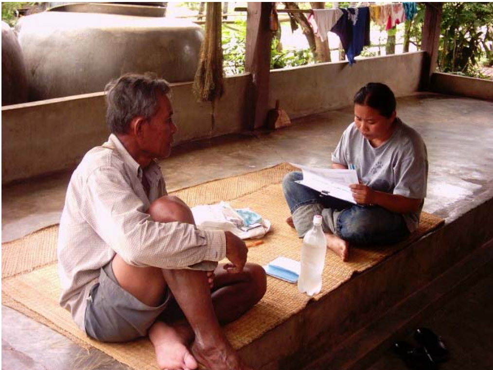
ภาพกิจกรรมการเก็บข้อมูลจากชาวบ้านที่อาศัยอยู่รอบๆแหล่งท่องเที่ยว ณ อุทยานแห่งชาติผาแต้ม