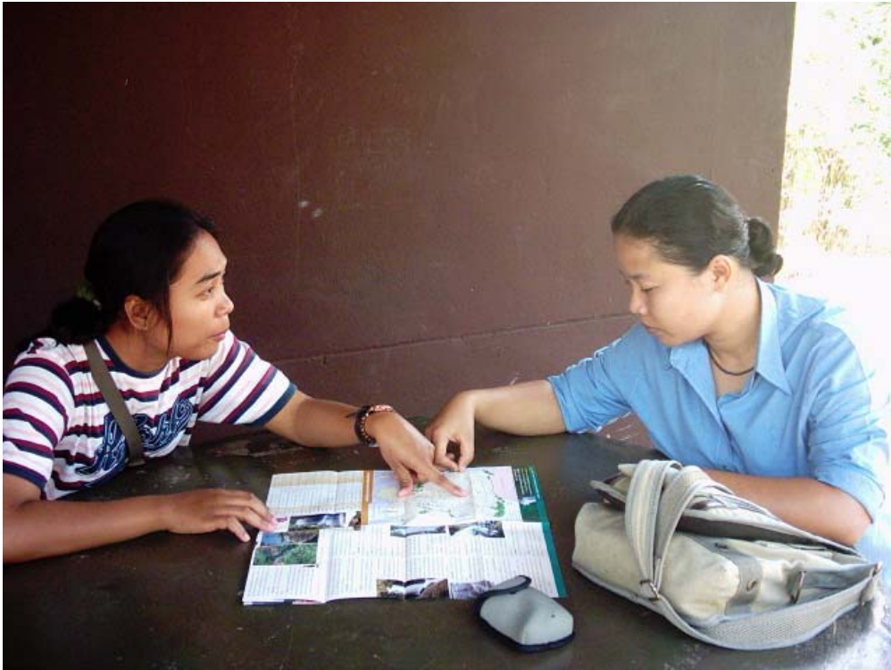
การเก็บรวบรวมข้อมูลเกี่ยวกับแหล่งท่องเที่ยวจากเอกสารต่างๆ