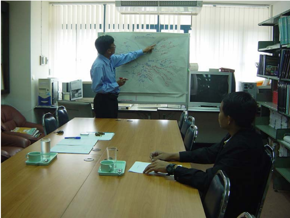
ภาพการระดมความคิดระหว่างนักวิจัยและเจ้าหน้าที่วนอุทยาน