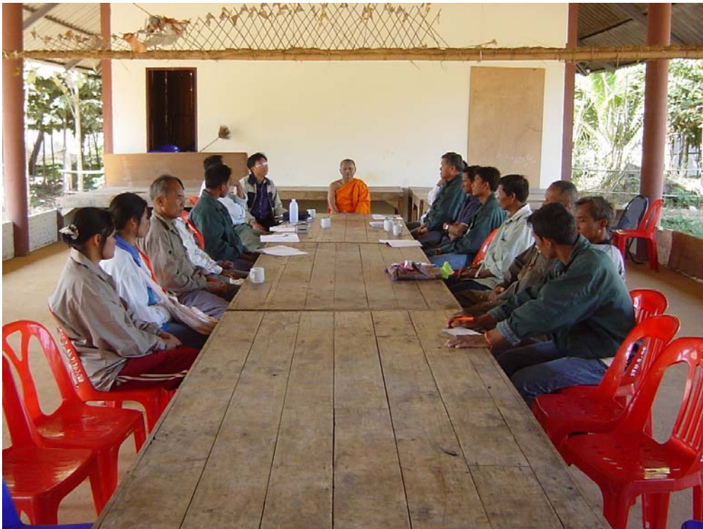
ภาพกิจกรรมเวทีเก็บข้อมูลระหว่างนักวิจัย เจ้าหน้าที่ และ ชุมชนเกี่ยวกับประเด็นการพัฒนาแหล่ง ท่องเที่ยวเขตรักษาพันธุ์สัตว์ป่าดงใหญ่