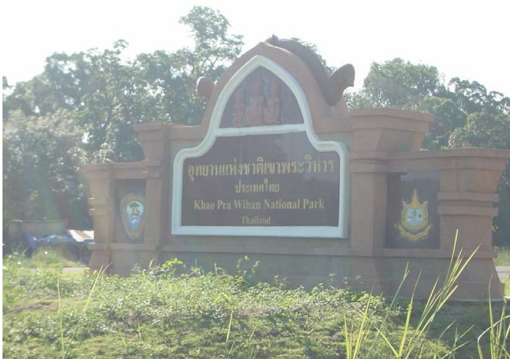
ภาพกิจกรรมการเก็บข้อมูลจากชาวบ้านที่อาศัยอยู่รอบๆแหล่งท่องเที่ยว ณ อุทยานแห่งชาติเขาพระวิหาร จ.ศรีสะเกษ