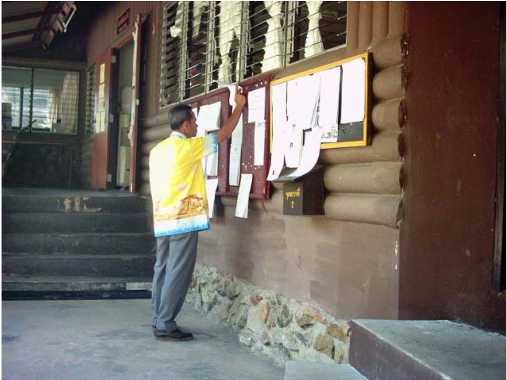
เจ้าหน้าที่อุทยานแห่งชาติผาแต้มกำลังค้นหาข้อมูลเกี่ยวกับหนังสือคำสั่งต่างๆจากป้ายประชาสัมพันธ์