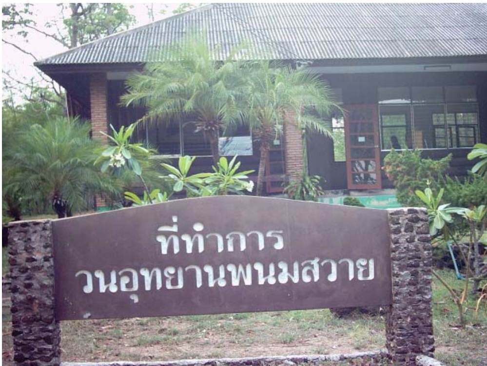
ที่ทำการวนอุทยานพนมสวาย