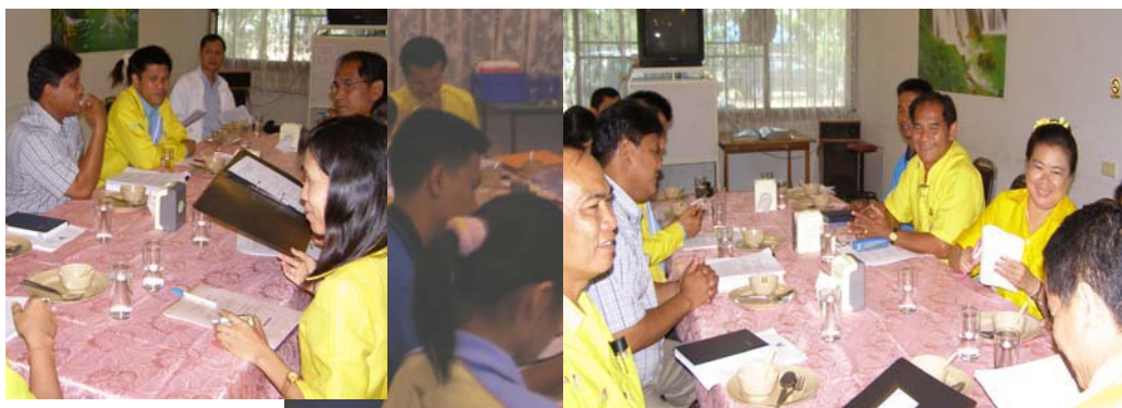
การวางแผน การตรวจสอบข้อมูล และการวิเคราะห์ข้อมูล