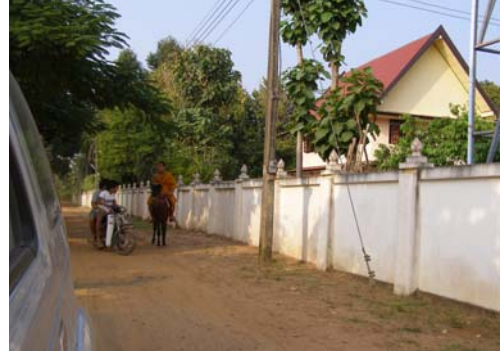
พระกับม้าในมูมหนึ่งของ จ.ศรีสะเกษ