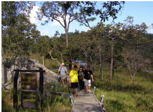
ทุ่งกระเจียว อ.เทพสถิต จ.ชัยภูมิ