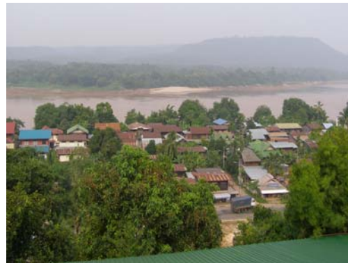
ความงามที่โขงเจียม จ.อุบลราชธานี