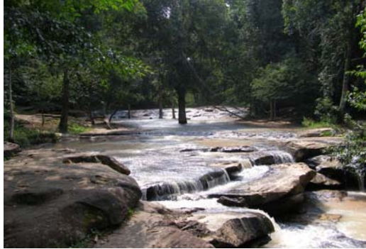
น้ำตกในอำเภอขุนหาญ จ.ศรีสะเกษ