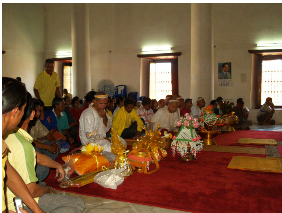
ภาพที่ 17 พิธีบวชพระที่วัดพระมหาธาตุวรมหาวิหาร