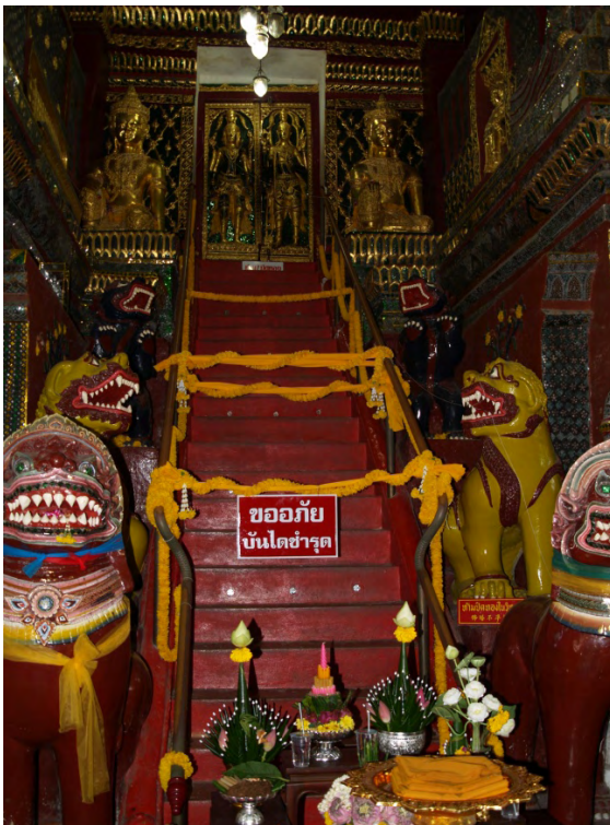
ภาพที่ 16 เทพนั่งชั้นเข้า ทำวช้ตตุคาม และ ทำวรามเทพ บริเวณประตูทางขึ้นเจดีย์พระธาตุนครศรีธรรมราช