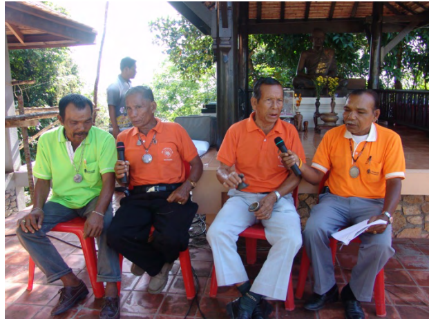
(เพลงบอกคณะสมใจ ศรีอุทุมพร)