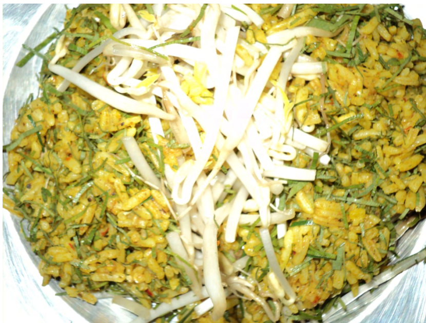
ภาพที่ 3 ขนมจีนน้ำแกง (น้ำยา)