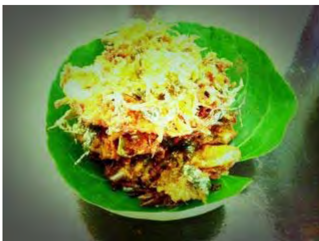
ภาพที่ 11 ขนมไข่ปลา