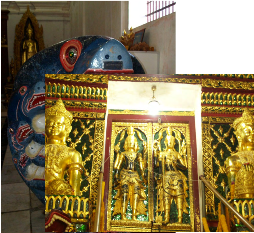
ภาพที่ 15 บันไดทางขึ้นเจดีย์พระธาตุนครศรีธรรมราชและบรรดาสัตว์จากการผูกภาพยนตร์