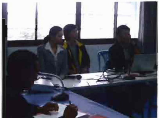
ประชุมคณะผู้บริหาร /ผู้วางนโยบาย ศูนย์การท่องเที่ยว กีฬา และนันทนาการ 6 จังหวัด