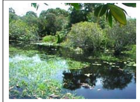
ภาพที่ 17-18 ป่าพรุที่ตำบลไม้ขาวจังหวัดภูเก็ต