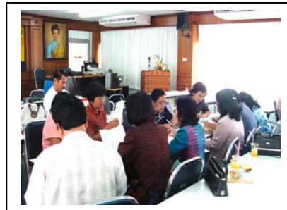
ภาพที่ 6 ระดมความคิดเกี่ยวกับศักยภาพชุมชน