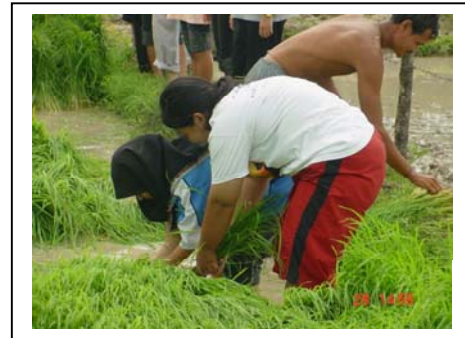
ภาพที่ 19-20 ดอกแพงพวยบานที่บ้านไม้ขาว และวิถีชีวิตการทำนา ตำบลไม้ขาวจังหวัดภูเก็ต