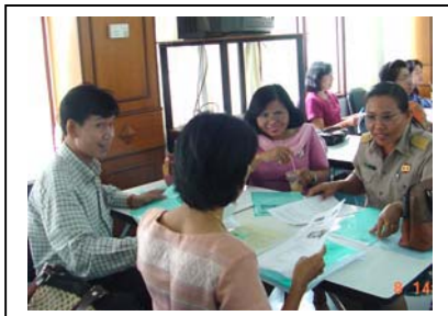
ภาพที่ 7 แต่ละกลุ่มสรุปศักยภาพชุมชน