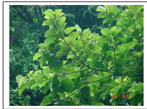
ภาพที่ 65-66 ป่าพรุสะเตียว จังหวัดกระบี่