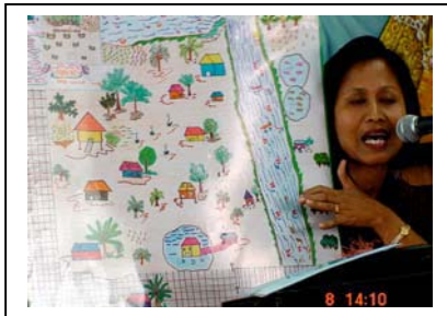
ภาพที่ 5 วิทยากรแนะนำแลกเปลี่ยน