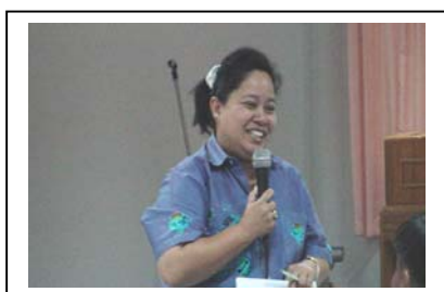
ภาพที่ 11 วิทยากรบรรยาย