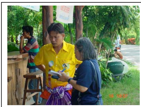
ภาพที่ 27-28 การทำส้มตำกลาง และเจ้าของบ้านวัฒนธรรม ตำบลเทพกระษัตรี จังหวัดภูเก็ต