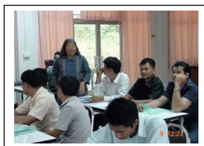
ภาพที่ 12 แลกเปลี่ยนเรียนรู้