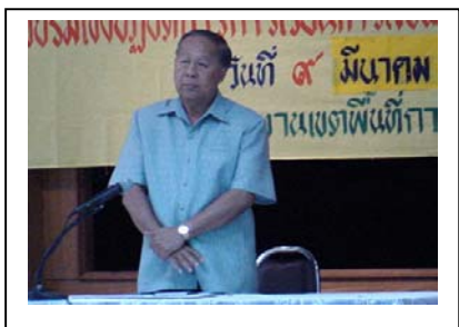
ภาพที่ 9 ประธานในพิธีเปิด