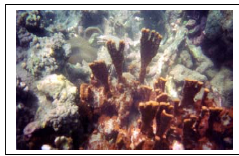
ภาพที่ 71-72 เกาะห้องและปะการังตีนผีที่หายาก ของตำบลเขาทอง จังหวัดกระบี่