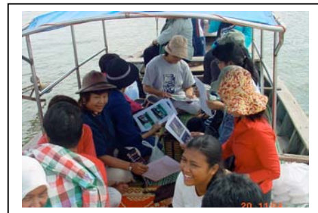
ภาพที่ 59-60 ตำบลคลองประสังค์ จังหวัดกระบี่