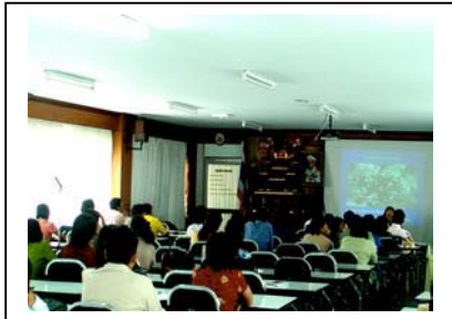
ภาพที่ 3 วิทยากรบรรยาย