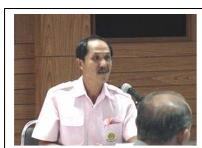
ภาพที่ 16 แต่ละกลุ่มนำเสนอ