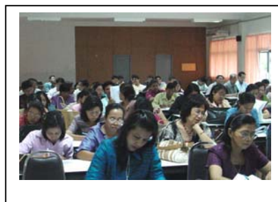
ภาพที่ 10 ผู้เข้าร่วมประชุม