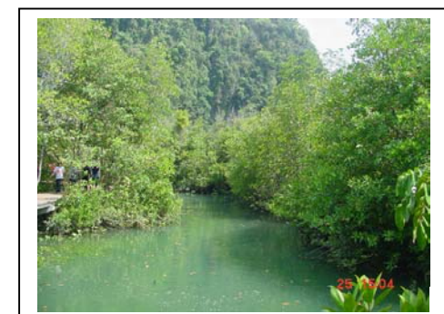
ภาพที่ 63-64 พรุทำปอม คลองสองน้ำ ตำบลเขาคราม จังหวัดกระบี่