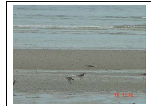
ภาพที่ 61-62 ตำบลปากน้ำ จังหวัดกระบี่