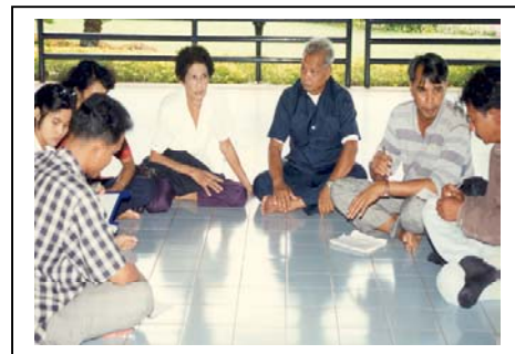
ภาพที่ 21-22 การจับจึกจั่นทะเล และการประชุมกลุ่ม ที่ตำบลไม้ขาวจังหวัดภูเก็ต