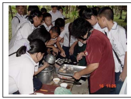
ภาพที่ 25-26 โนราบิด และการทำขนมครก บ้านวัฒนธรรม ตำบลเทพกระษัตรี จังหวัดภูเก็ต