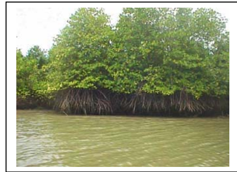
ภาพที่ 57-58 ตำบลคลองประสังค์ จังหวัดกระบี่