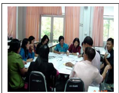
ภาพที่ 15 ร่วมกันประเมินศักยภาพชุมชน