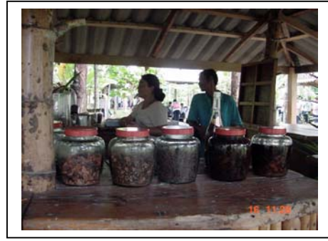
ภาพที่ 23-24 จักสาน และยาดอง บ้านวัฒนธรรม ตำบลเทพกระษัตรี จังหวัดภูเก็ต