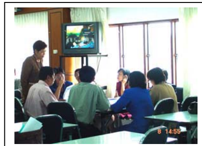
ภาพที่ 8 ร่วมกันประเมินศักยภาพชุมชน