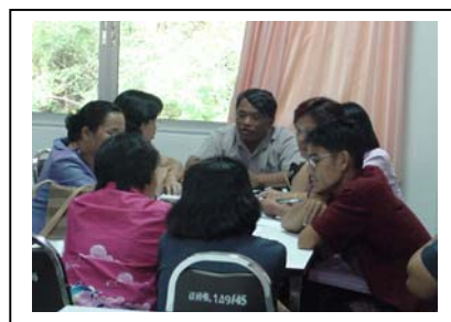
ภาพที่ 14 สรุปศักยภาพชุมชนแต่ละกลุ่ม