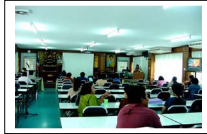
ภาพที่ 2 ผู้เข้าร่วมประชุม