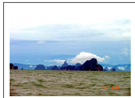
ภาพที่ 29-30 ตำบลปาดลอก จังหวัดภูเก็ต