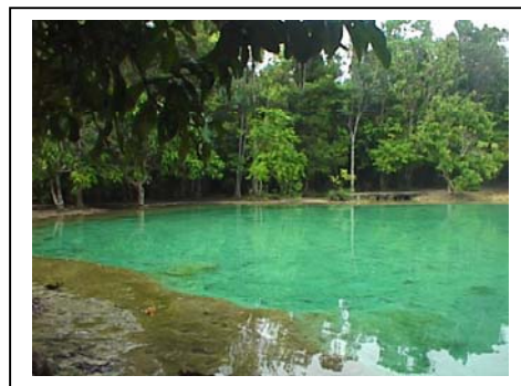
ภาพที่ 75-76 น้ำตกกร้อน และสระมรกต ตำบลคลองท่อม จังหวัดกระบี่