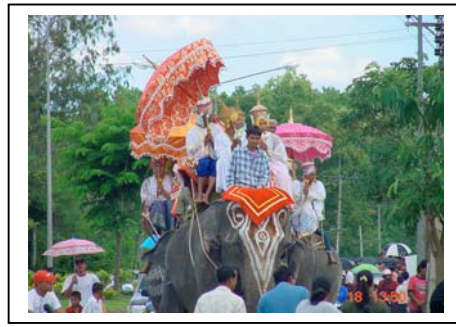
ภาพที่ 73-74 การบวชช้างที่ตำบลเขาพนม จังหวัดกระบี่