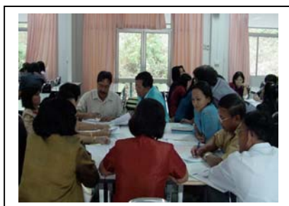
ภาพที่ 13 ระดมความคิดเกี่ยวกับศักยภาพชุมชน