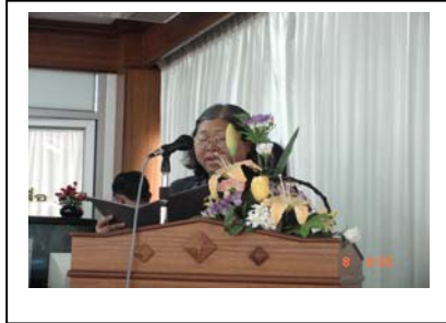
ภาพที่ 1 หัวหน้าโครงการ