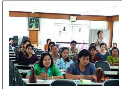
ภาพที่ 4 ผู้เข้าร่วมประชุมรับฟัง