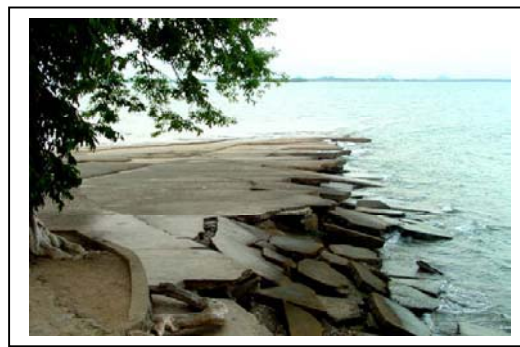
ภาพที่ 77-78 ภูเขา และ สุสานหอย ตำบลไสไทย จังหวัดกระบี่