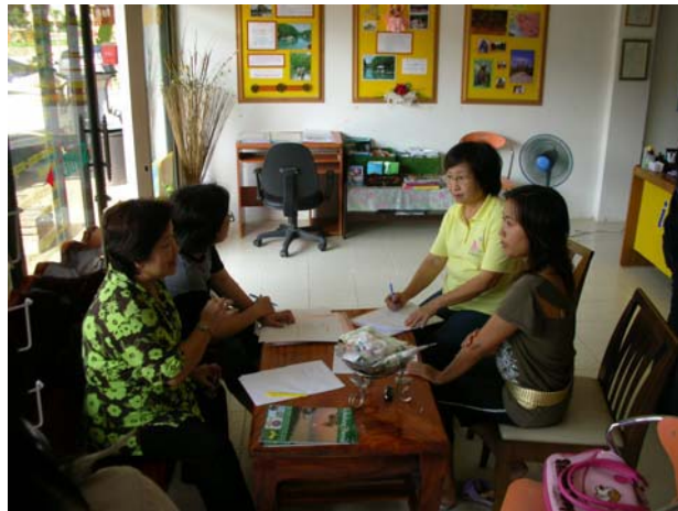
การสัมภาษณ์ผู้แทนชมรมมัคคุเทศก์