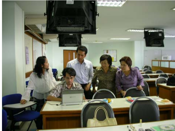
การประชุมระหว่างนักวิจัยที่มหาวิทยาลัยรามคำแหง