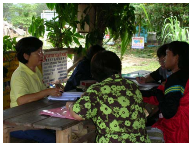
การสัมภาษณ์ผู้ประกอบการนั่งช้าง ชูตินันท์