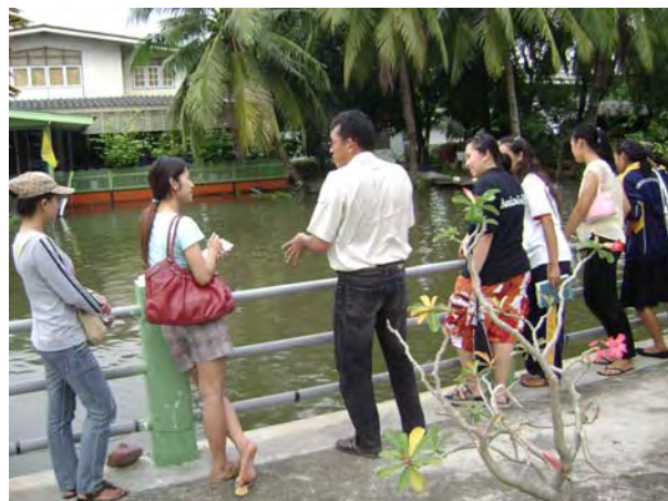
มัคคุเทศก์อธิบายความรู้ทั่วไปก่อนลงเรือ