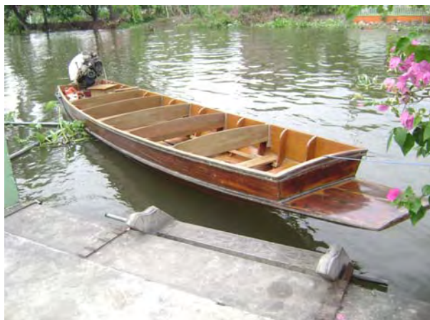
เรือที่ใช้นั่งได้ 8-10 คน