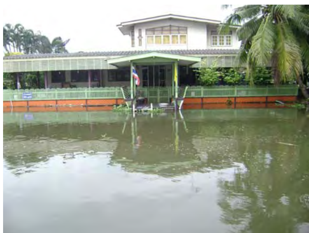
บ้านเรือนบริเวณริมคลองจินดา