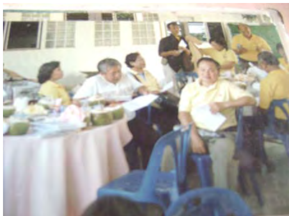
นักท่องเที่ยวนั่งพักผ่อนและชิมผลไม้