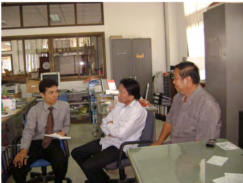
ผู้วิจัยกำลังสัมภาษณ์นายกองดีการบริหารส่วนตำบลคลองจินดา (กลาง) และรองนายกฯ (ขวา)