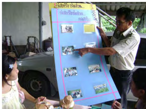
นิทรรศการข้อมูลสำหรับอธิบายนักท่องเที่ยว