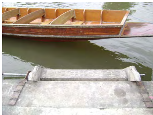
ท่าลงเรือสำหรับนักท่องเที่ยว