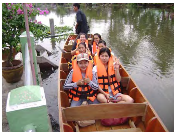
ขณะล่องเรือมีเสื้อชูชีพบริการแก่นักท่องเที่ยว