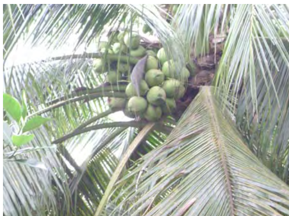
สวนมะพร้าว น้ำหอม