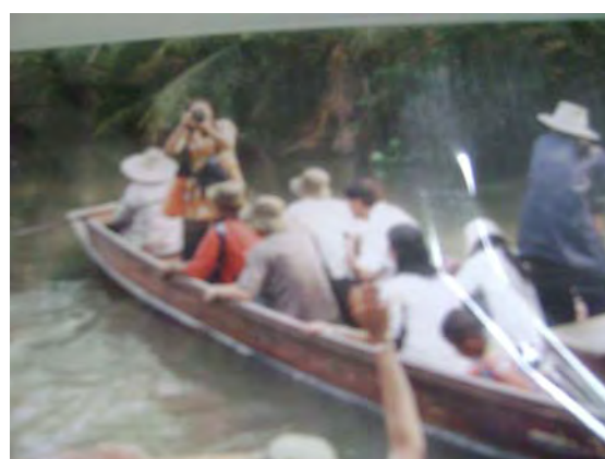
คณะนักท่องเที่ยวกลุ่มต่าง ๆ ในอดีต ยังไม่มีบริการเสื้อชูชีพ