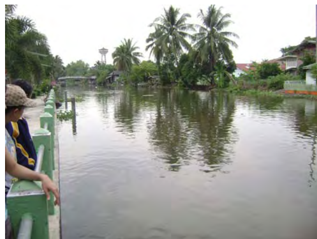
สภาพทั่วไปของคลองจินดา