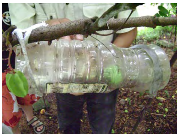
ภูมิปัญญาการใช้วัสดุง่าย ๆ สำหรับ ดักจับแมลงวันทองในสวนผลไม้