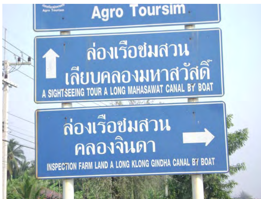
ป้ายบอกเส้นทางท่องเที่ยวล่องเรือชมสวนคลองจินดา