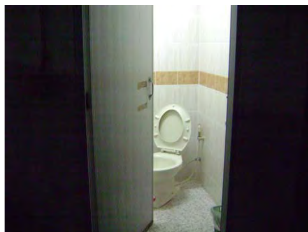
ห้องสุขาสำหรับบริการนักท่องเที่ยว