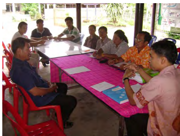
การประชุมกลุ่มย่อยระหว่างคณะผู้วิจัยกับผู้นำชุมชน