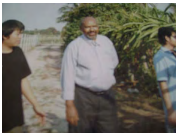
นักท่องเที่ยวชาวต่างชาติ