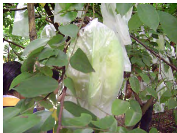
สวนมะเฟืองหวาน