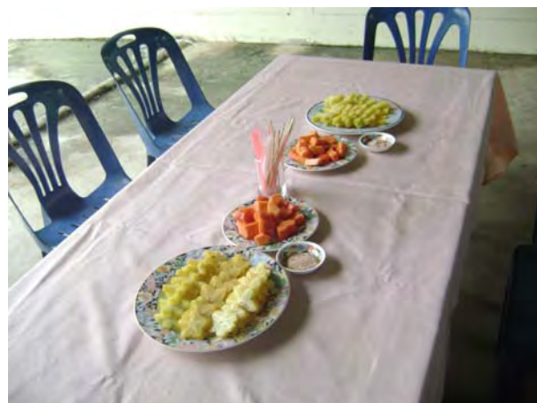
ผลไม้จากสวนสำหรับให้นักท่องเที่ยวชิม