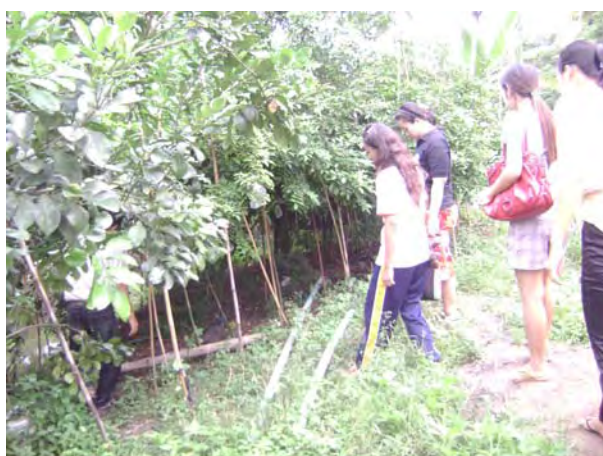
นักท่องเที่ยวขึ้นชมสวนผลไม้