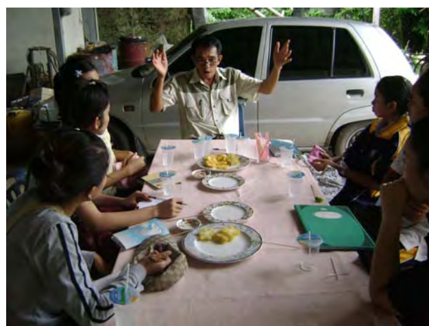
นักศึกษาสัมภาษณ์ผู้นำชุมชน