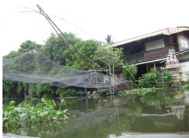
การยกยอ วิถีชีวิตริมคลองจินดา