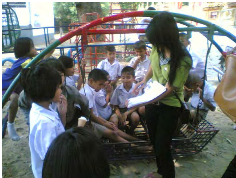
ภาพที่ 1 สัมภาษณ์เยาวชนคุ้มวัดท่าวังหิน