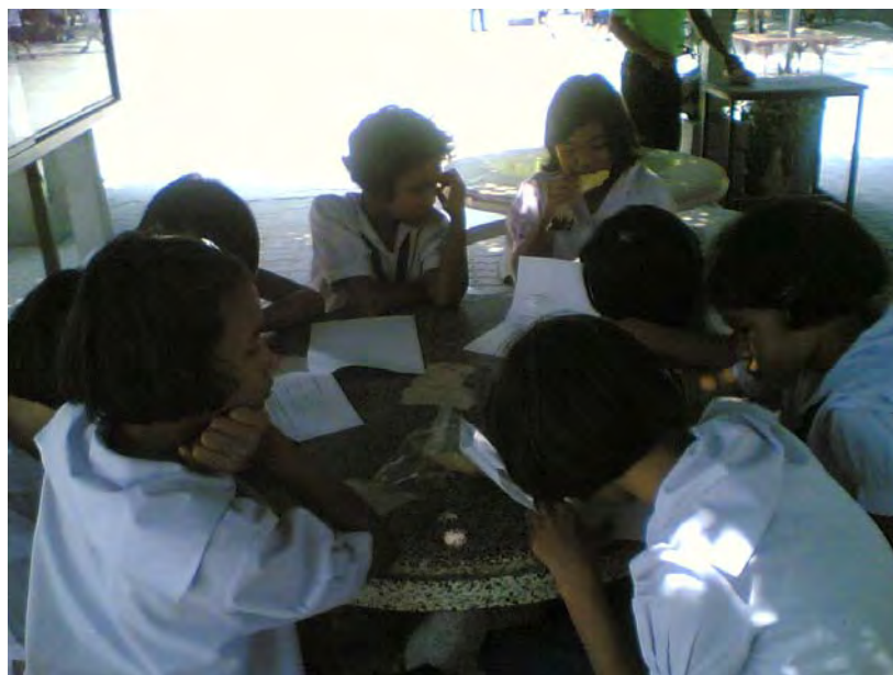
ภาพที่ 3 สัมภาษณ์เยาวชนชนคุ่มวัดมณีวนารามเกี่ยวกับแนวทางการอนุรักษ์ งานประเพณีแห่เทียนพรรษาจังหวัดอุบลราชธานี