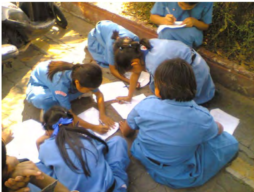
ภาพที่ 9 เยาวชนคุ้มวัดพระธาตุหนองบัวร่วมแสดงความคิดเห็นแนวทางการอนุรักษ์งานประเพณีแห่เทียนพรรษาจังหวัดอุบลราชธานี