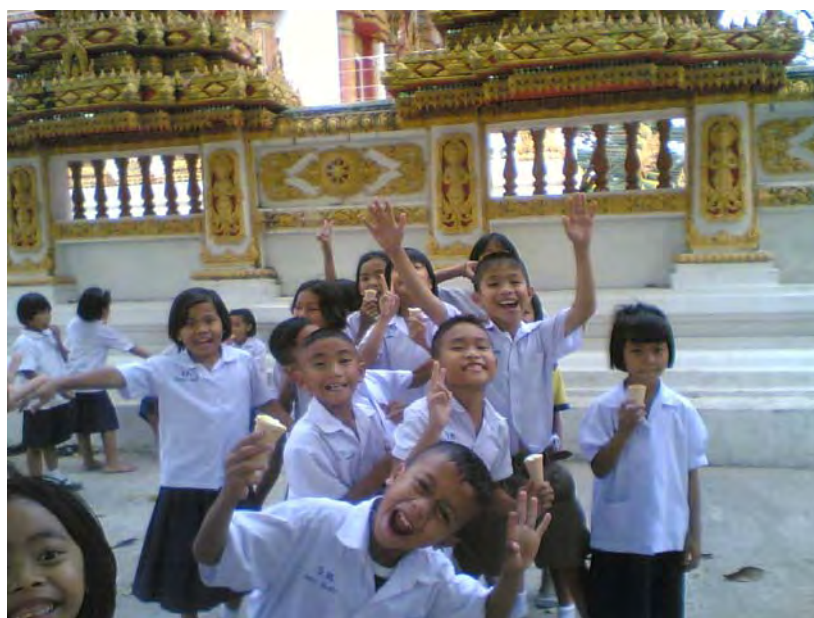
ภาพที่ 2 เยาวชนคุ้มวัดท่าวังหินที่ร่วมแสดงความคิดเห็นแนวทางการอนุรักษ์ งานประเพณีแห่เทียนพรรษาจังหวัดอุบลราชธานี