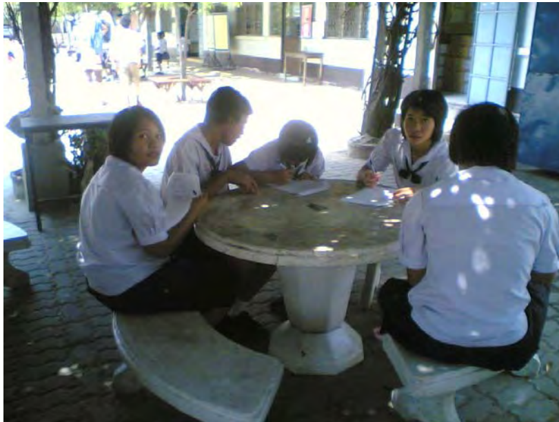
ภาพที่ 5 เยาวชนคุ้มวัดทุ่งศรีเมืองร่วมแสดงความคิดเห็นแนวทางการอนุรักษ์งานประเพณีแห่เทียนพรรษาจังหวัดอุบลราชธานี