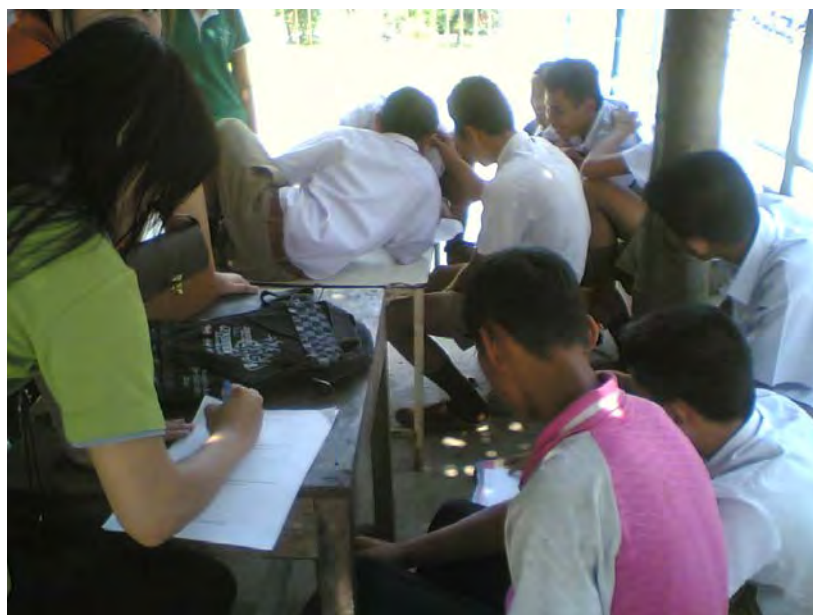
ภาพที่ 4 เยาวชนคุ่มมณีวนารามร่วมแสดงความคิดเห็นแนวทางการอนุรักษ์ งานประเพณีแห่เทียนพรรษาจังหวัดอุบลราชธานี