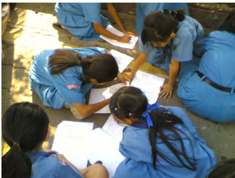
ภาพที่ 10 เยาวชนคุ้มวัดพระธาตุหนองบัวร่วมแสดงความคิดเห็นแนวทางการอนุรักษ์งานประเพณีแห่เทียนพรรษาจังหวัดอุบลราชธานี