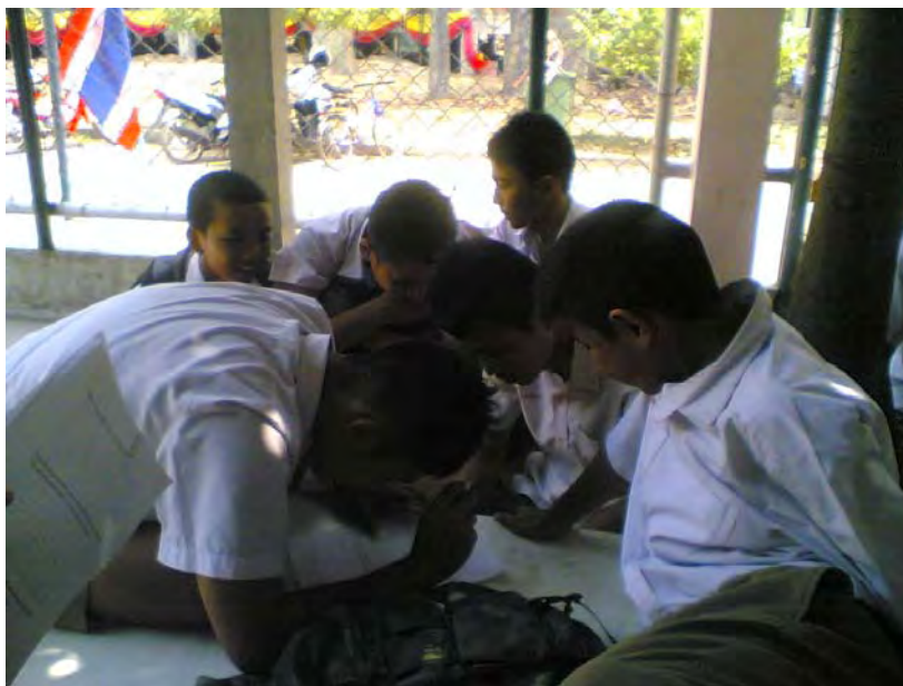
ภาพที่ 6 เยาวชนคุ้มวัดทุ่งศรีเมืองร่วมแสดงความคิดเห็นแนวทางการอนุรักษ์งานประเพณีแห่เทียนพรรษาจังหวัดอุบลราชธานี