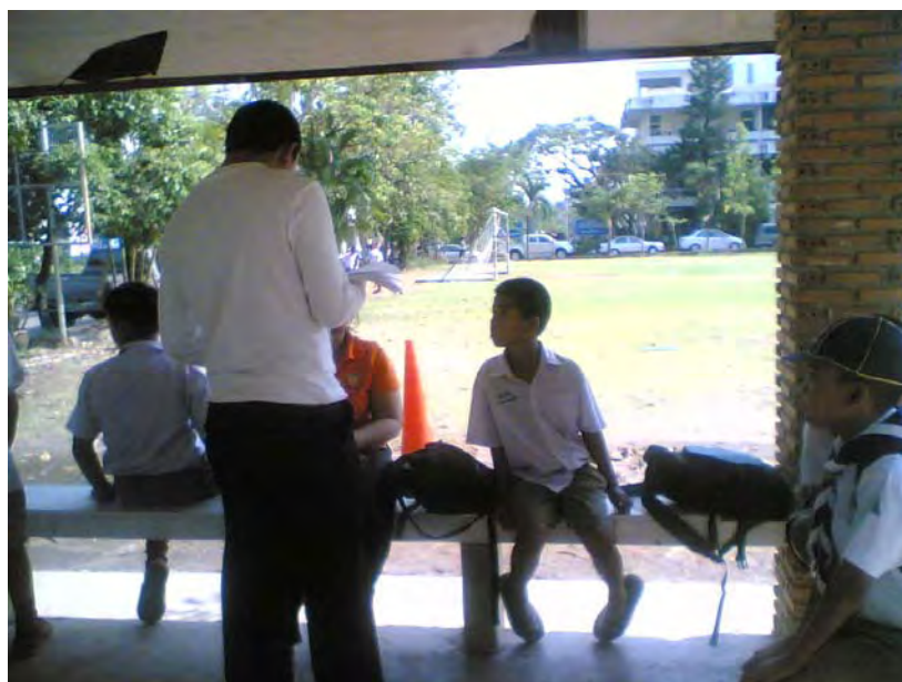
ภาพที่ 8 เยาวชนคุ้มวัดพระธาตุหนองบัวร่วมแสดงความคิดเห็นแนวทางการอนุรักษ์งานประเพณีแห่เทียนพรรษาจังหวัดอุบลราชธานี