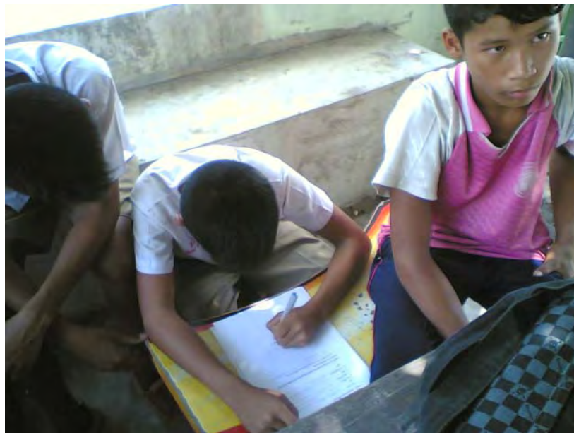
ภาพที่ 7 เยาวชนคุ้มวัดมณีวนารามร่วมแสดงความคิดเห็นแนวทางการอนุรักษ์งานประเพณีแห่เทียนพรรษาจังหวัดอุบลราชธานี