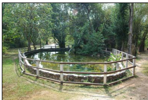
ภาพ 7 : บ่อน้ำพุร้อน (หนองหญ้าปล้อง)