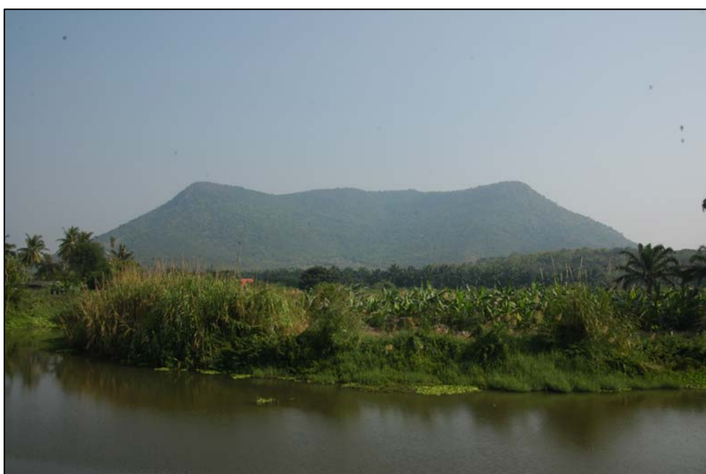
ภาพที่ 1 : เขากะทิง