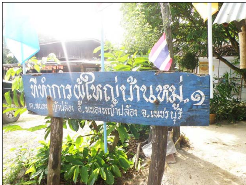
ภาพที่ 4 : แหล่งการเรียนรู้ตามหลักปรัชญาเศรษฐกิจพอเพียง