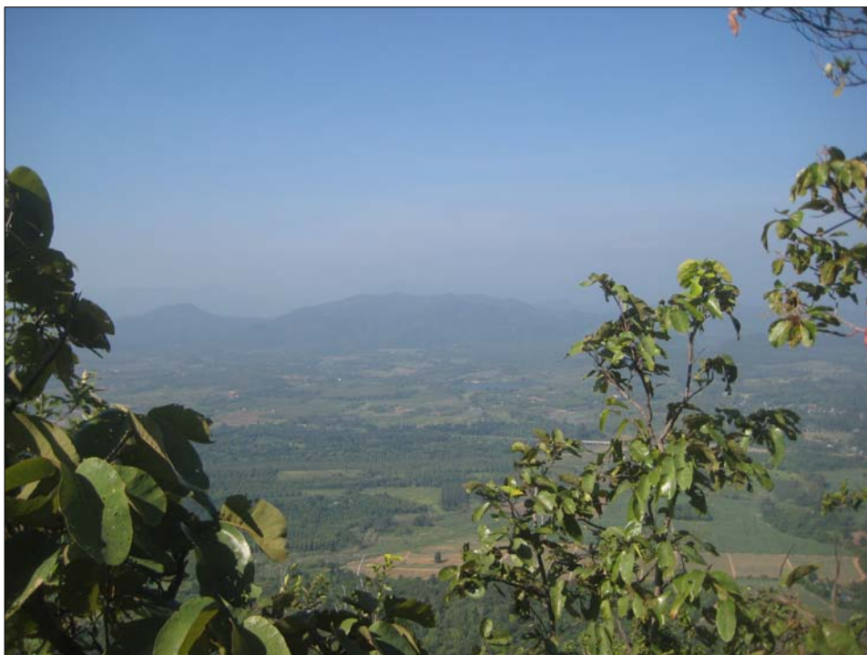
ทัศนียภาพของ อ.หนองหญ้าปล้อง จากมมสูงบนเขากระทิง