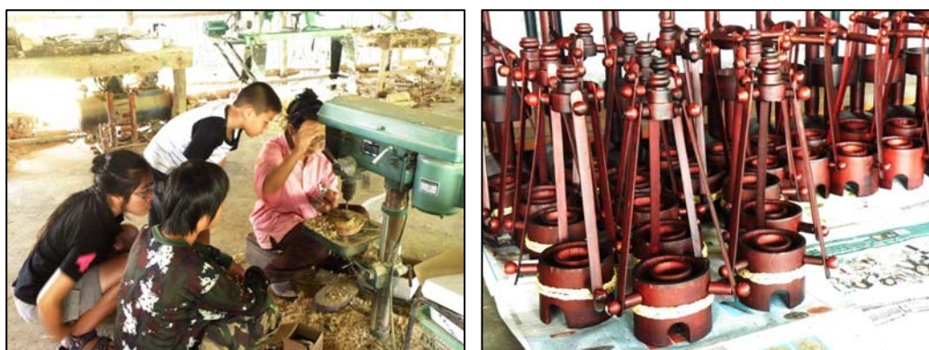
ภาพ 6 : กลุ่มหัตถกรรมพื้นบ้านหมู่ 1 ผลิตภัณฑ์จากไม้ไผ่