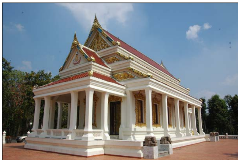
ภาพ 3 : วัดวังฟูไทร