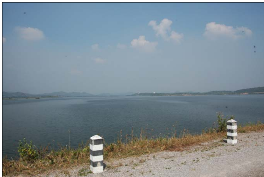
ภาพ 2 : เขื่อนแม่พระจันทร์