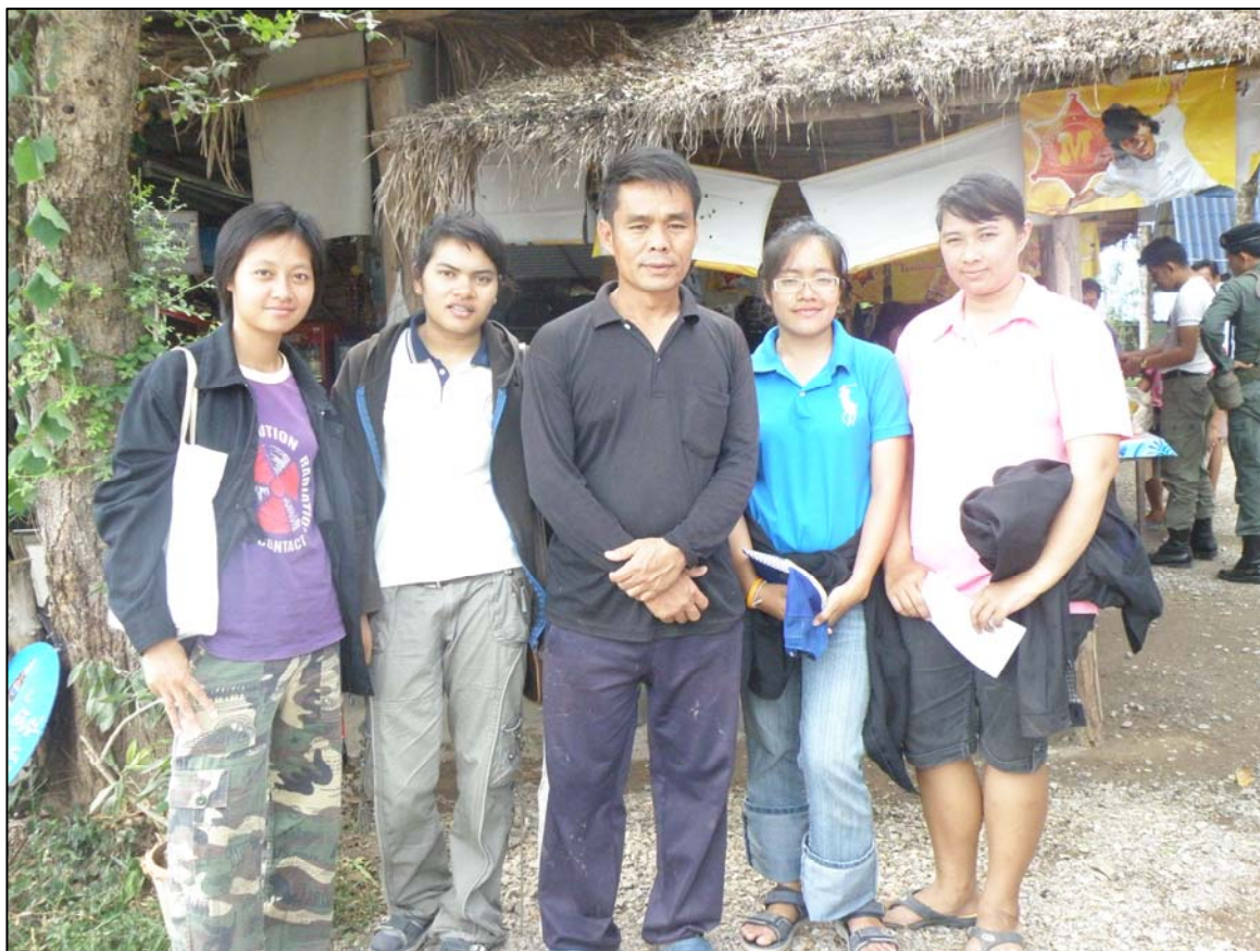
กลุ่มคณะนักวิจัยกับแกนนำกลุ่มจัดการท่องเที่ยวบ่อน้ำพุร้อน อ.หนองหญ้าปล้อง