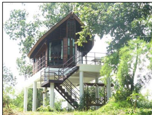
ภาพที่ 8 : น้ำตกห้วยกวางใจและที่พัก