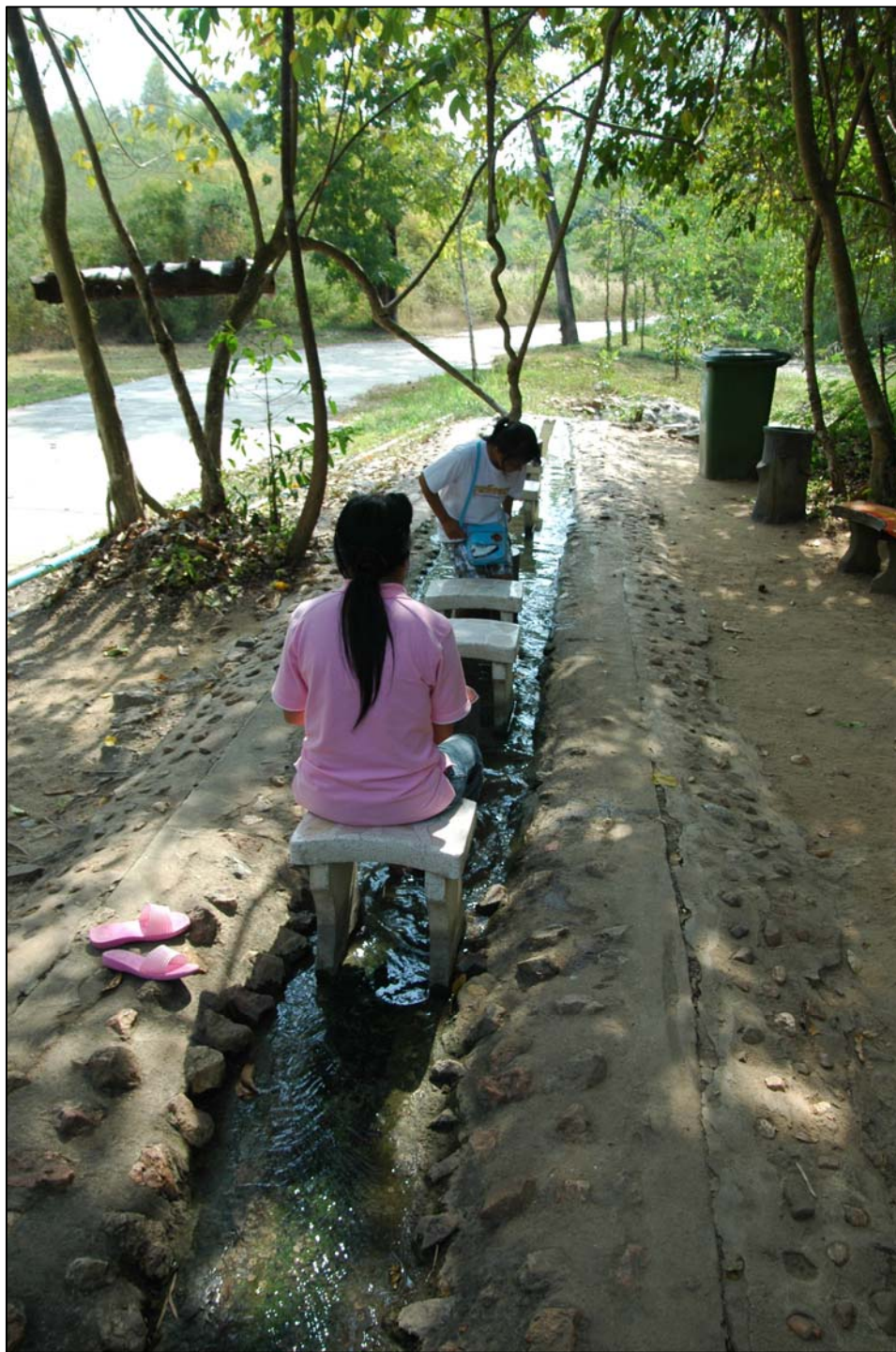
เก้าอี้นั่งแช่เท้าบริเวณบ่อน้ำพุร้อน ซึ่งทางกลุ่มชาวบ้านริเริ่มจัดการท่องเที่ยวได้จัดไว้ให้นักท่องเที่ยวได้ใช้แช่เท้า