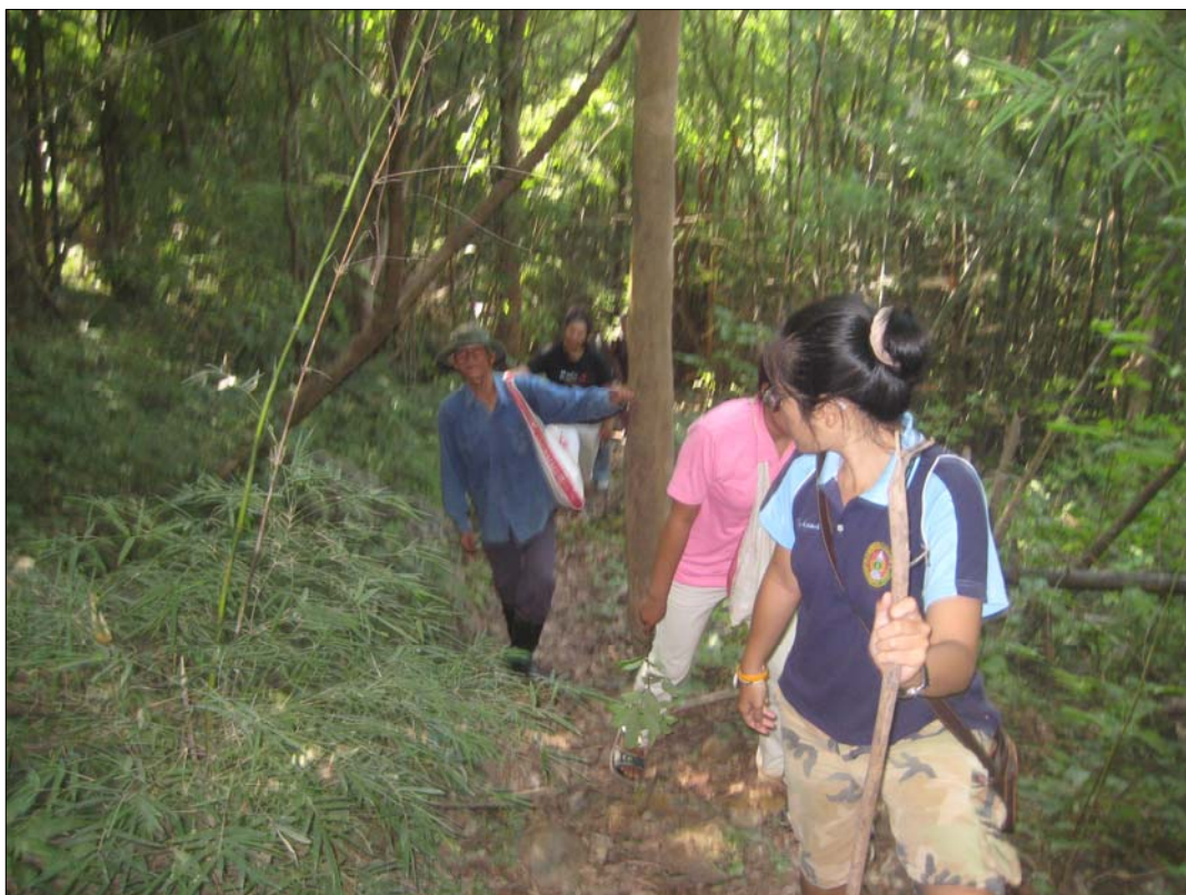
คณะนักวิจัยกำลังเดินขึ้นสำรวจเส้นทางท่องเที่ยวเขากระทิง