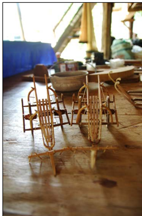
ภาพที่ 5 : คุณลุงสงครามต์ เสนาไลहित ปราชญ์ชาวบ้านกับผลิตภัณฑ์เกวียนโบราณจำลอง ของกลุ่มหัตถกรรมหมู่บ้านหมู่ 4