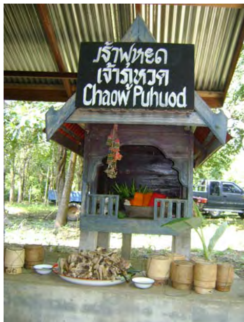
ภาพที่ 17 พาเสื่อผ้าของหอที่ 4 หอเจ้าหวด

สำหรับชาวบ้านแต่ละครัวเรือนต้องนำ เหล้าครัวเรือนละ 1 ขวด กระจิบข้าวครัวเรือนละ 1 กระจิบ ข้าวเม้า ดอกแก้ว (ใบของดอกยี่โถ) และเทียน (ชาวไทดำไม่ใช้ธูปในการเช่น ไหว้เจ้าคน) ใใส่ในกรวย 1 กรวย ซึ่งผู้หญิงที่เป็นผู้เฒ่าผู้แก่ประจำหมู่บ้าน เป็นผู้จัดทำพาเสื่อพาผ้า และเป็นผู้แยก ดอกไม้ เทียน ของชาวบ้านออกจากกัน