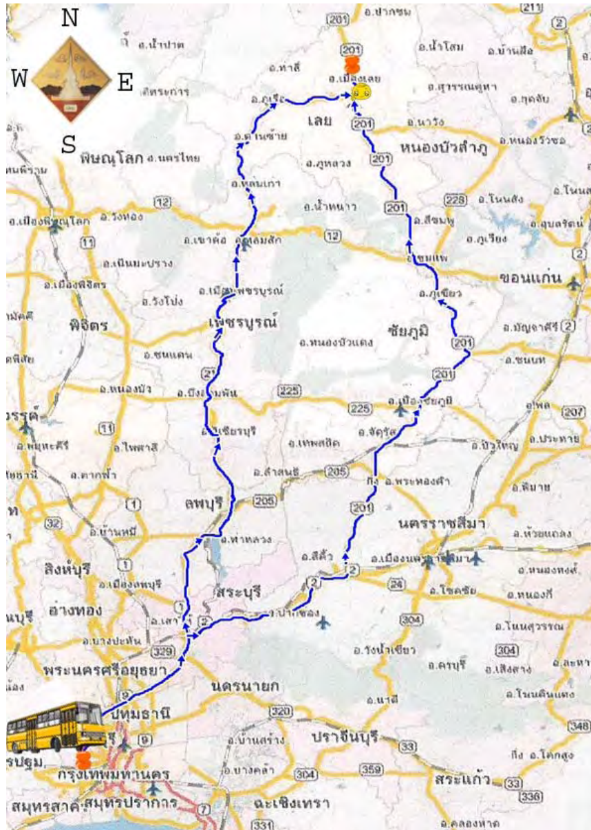
ภาพที่ 3 การเดินทางระหว่างกรุงเทพมหานคร – จังหวัดเลย