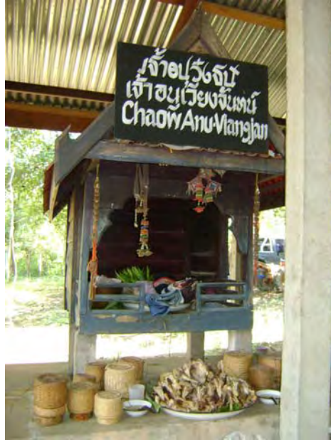
ภาพที่ 15 พาเสื่อผ้าของหอที่ 2 หอเจ้าอนุวงศ์