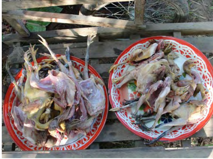
ภาพที่ 18 ไก่ และเครื่องในไก่ที่ทำความสะอาดเรียบร้อยแล้ว พร้อมนำไปต้ม