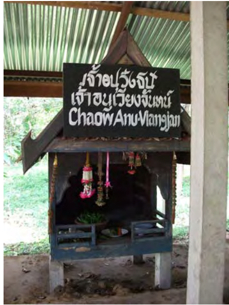
ภาพที่ 9 หอเจ้านูนวงศ์ หรือเจ้าอนุเวียงจันทน์

3. หอเจ้าภูแก้ว คือ ภูเขาที่ตั้งอยู่ทางทิศตะวันออกเฉียงเหนือของบ้านนาป่าหนาด ถือว่าเป็นหอเจ้าบ้านที่สำคัญอีกหอหนึ่ง ซึ่งชาวไทดำได้มาพึ่งพาอาศัยในบริเวณอาณาเขตของท่าน และชาวไทดำเชื่อว่าเป็นผู้ที่ให้พื้นดินและแหล่งน้ำ ในการตั้งถิ่นฐานของชาวไทดำมาตั้งแต่อดีต