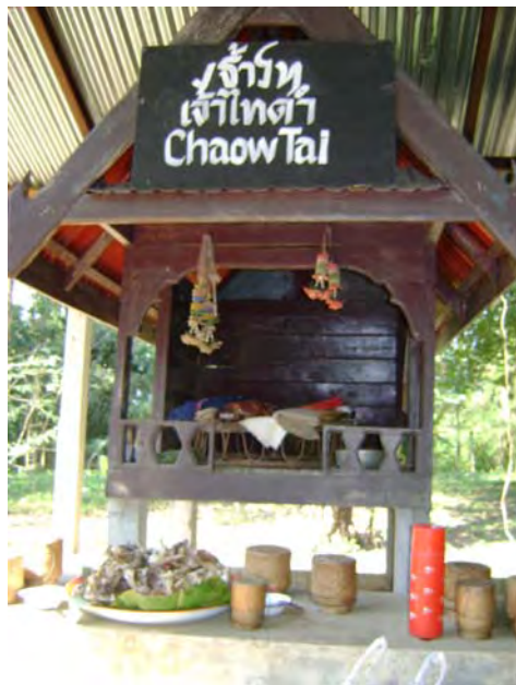
ภาพที่ 14 พาเสื้อผ้าของหอที่ 1 หอเจ้าไทดำ

3.3.2 พาเสื้อผ้าของหอที่ 2 หอเจ้าอนุวงศ์