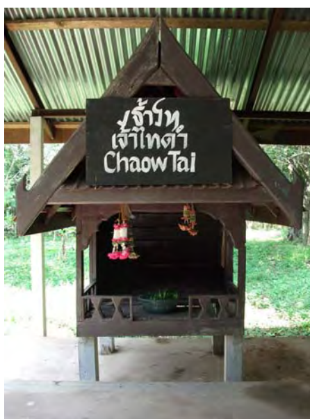
ภาพที่ 8 หอเจ้าไทดำ

1. หอเจ้าไทดำ หรือหอเจ้าตาผ้าขาว (ชีปะขาว) ที่เรียกอย่างนี้ เนื่องจากชาวไทดำเชื่อว่า ท่านุ่นขาวห่มขาว ซึ่งท่านคือดวงวิญญานศักดิ์สิทธิ์หรือเถน ที่เป็นบรรพบุรุษ เป็นต้นกำเนิดของเผ่าพันธุ์ไทดำ คอยปกป้องคุ้มครองลูกหลานชาวไทดำมาโดยตลอด