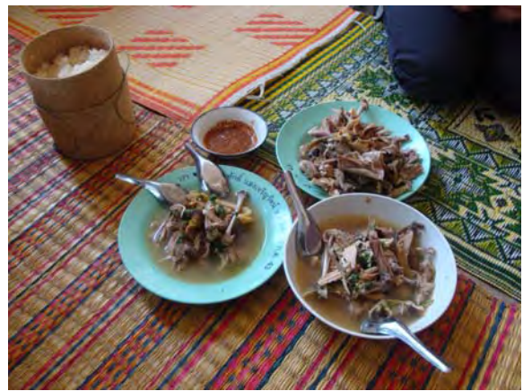
ภาพที่ 26 ไก่ต้มหลังจากการทำพิธีเลี้ยงบ้าน ซึ่งชาวไทดำจะนำมาทำซั่วไก่เพื่อรับประทานร่วมกัน