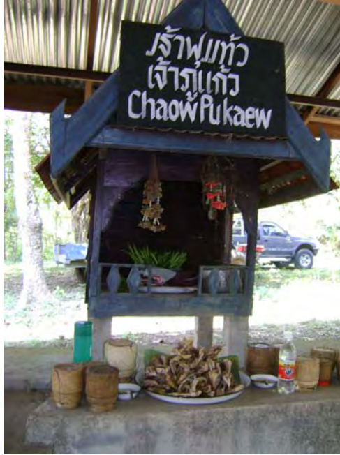
ภาพที่ 16 พาเสี้ยวของหอที่ 3 หอเจ้าแก้ว