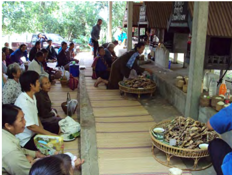
ภาพที่ 21 บรรยายการประกอบพิธีกรรมเลี้ยงบ้าน