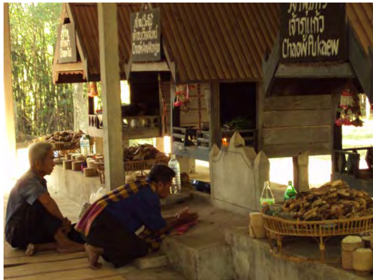
ภาพที่ 22 เจ้าจ้ำประกอบพิธีกรรมเลี้ยงบ้าน

“คนแต่เค้า ผู้เฒ่าแต่ก่อน ท้าวมือรุน ขุนมือก่อน เจ้าภูหอขาว ภูลาวเจ้าหัวค้อน เจ้าหมกหมอนลงดิน เจ้ามีดินมีตาขึ้นใหม่ เทวดาลวงเจ้าขึ้นใหม่หัวสูง เจ้าที่เจ้าทางเอ๋ย เจ้าอนุเวียง จันทรคีติ เจ้าภูแก้ว ภูหวดคีติ ยะกันมา มื้อนี้สี่เลี้ยงสี่เกียไก่อเด้อ” สามารถแสดงภาพได้ดังภาพต่อไปนี้