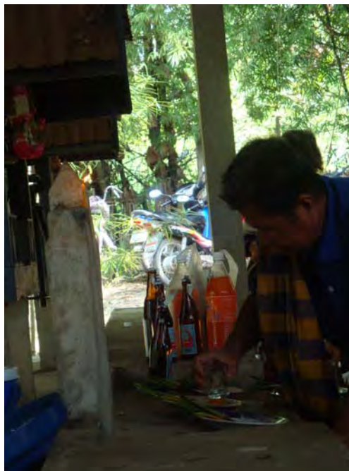
ภาพที่ 24 เจ้าจ้ทำพิธีบอกล่าวหอเจ้าบ้าน หรือแก่นนให้กับชาวบ้าน