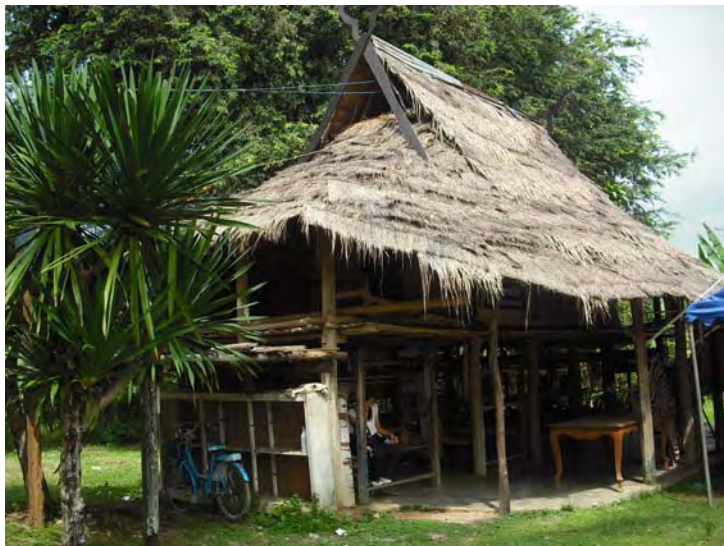
ภาพที่ 7 บ้านของชาวไทดำ