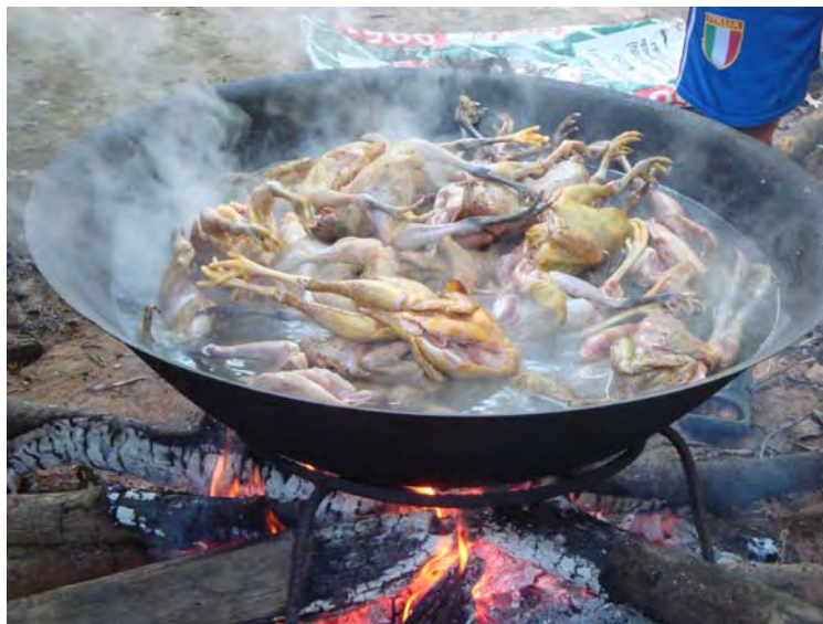
ภาพที่ 19 การต้มไก่ และเครื่องในไก่ในกระทะ (ใส่เฉพาะเกลือ)

3.4 พอไก่ที่ต้มสุกแล้ว นำไก่ พร้อมเครื่องในไก่ แบ่งใส่พาช้าวทั้ง 4 พาให้เท่า ๆ กัน และตักน้ำต้มไก่ใส่ถ้วยพาละ 2 ถ้วย วางด้านซ้ายมือ และขวามือ สามารถแสดงภาพได้ดังภาพต่อไปนี้