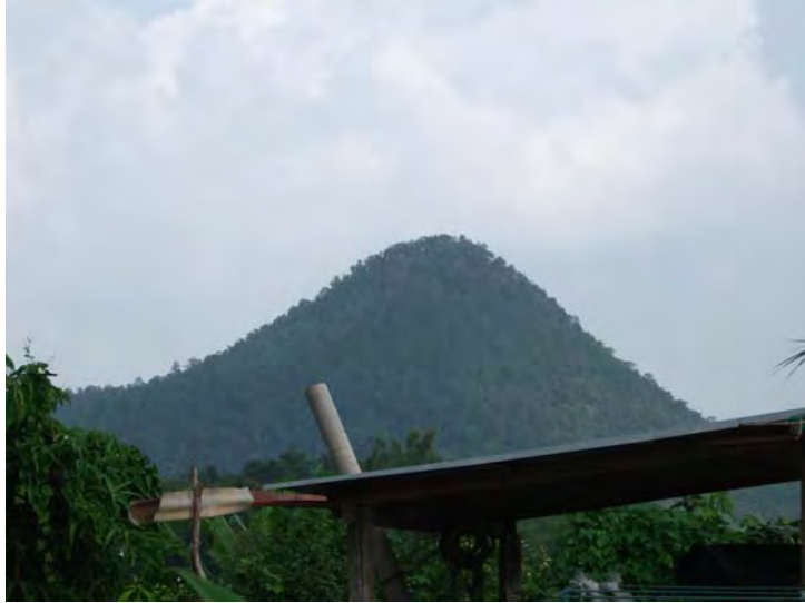
ภาพที่ 5 ภูหวด

ทางทิศใต้เป็นที่ตั้งของสถานีอนามัย และทิศตะวันตกเป็นที่ตั้งของโรงเรียนบ้านนาป่า หนาด โรงเรียนเขาแก้ววิทยาสรรพ์ ซึ่งเป็นโรงเรียนประถม และมีชมประจำตำบลเขาแก้ว นอกจากนี้ป่าช้า ศาลเจ้าบ้าน หรือหอเจ้าบ้านก็ตั้งอยู่ที่ทิศตะวันตกด้วย