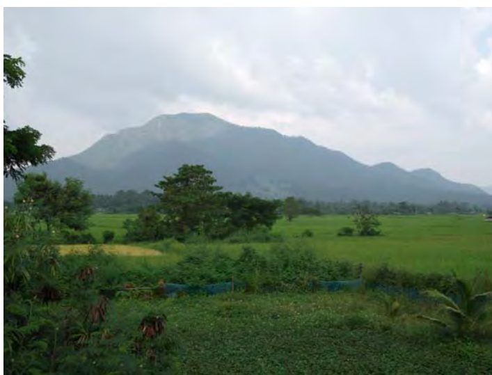
ภาพที่ 4 ภูแก้ว

บ้านนาป่าหนาดตั้งอยู่บนที่สูง ซึ่งชาวอีสานเรียกว่า “โคก” ลักษณะพื้นที่ทางทิศเหนือเป็นที่ลุ่มเป็นที่ทำนาของชาวบ้าน ทางทิศตะวันออกเป็นที่ดอน มีภูเขา 2 ลูก คือ ภูแก้ว และภูหวด ซึ่งเป็นที่ที่ชาวบ้านนิยมไปหาของป่ามาใช้ในการดำรงชีวิต