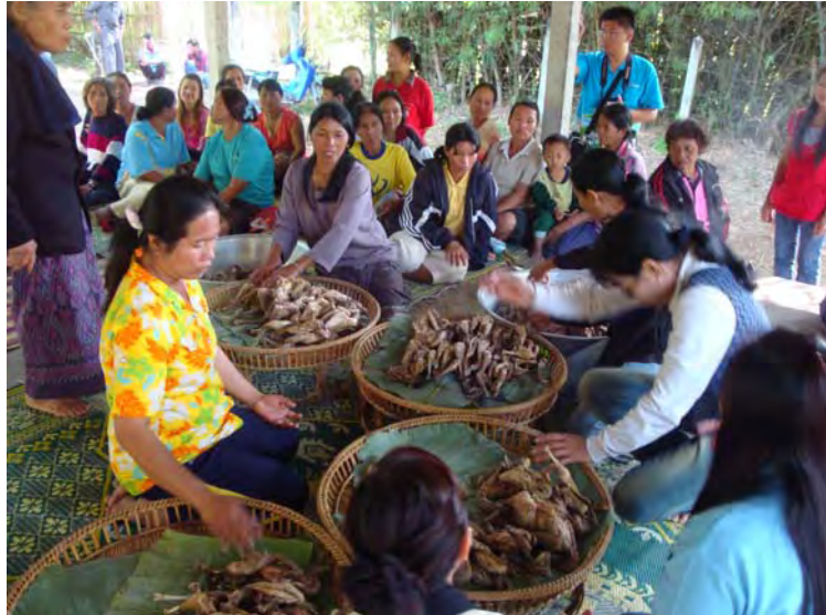
ภาพที่ 20 การแบ่งไถ่ลงในพาส้ว สำหรับแต่ละหอ