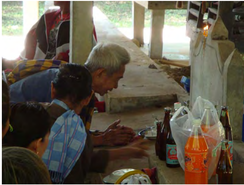
ภาพที่ 25 เจ้าเชื้อ (ผู้ช่วยเจ้าจ้ำ) ทำพิธีบอกกล่าวหอบเจ้าบ้าน หรือแก่นนให้กับชาวบ้าน