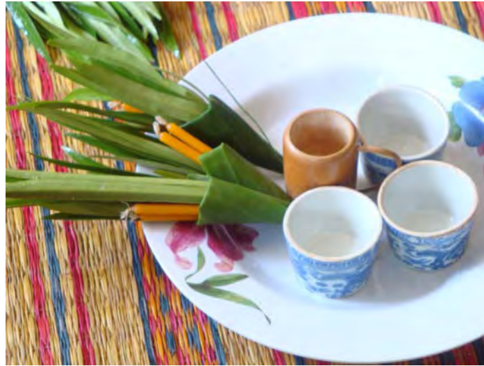
ภาพที่ 23 อุปกรณ์ที่ใช้สำหรับบอกล่าวหอเจ้าบ้าน หรือแก่นน