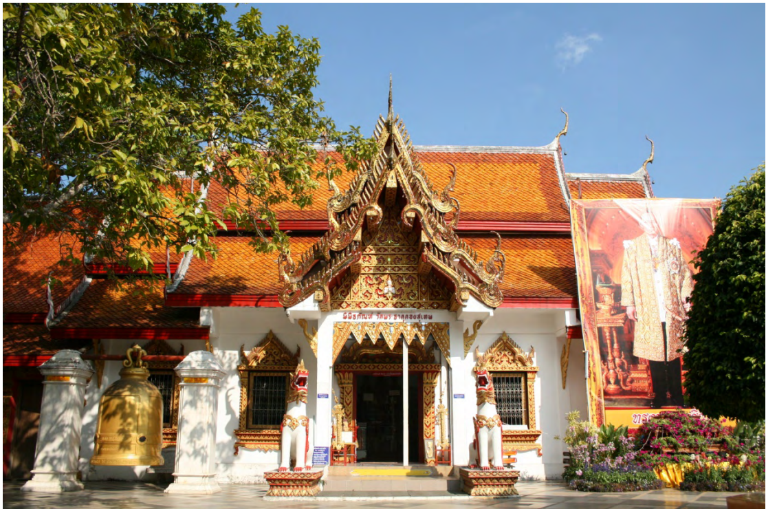
ภาพที่ 3 วัดพระธาตุดอยสุเทพ