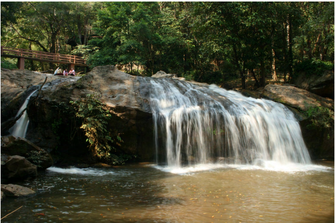
ภาพที่ 2 น้ำตกแม่สา