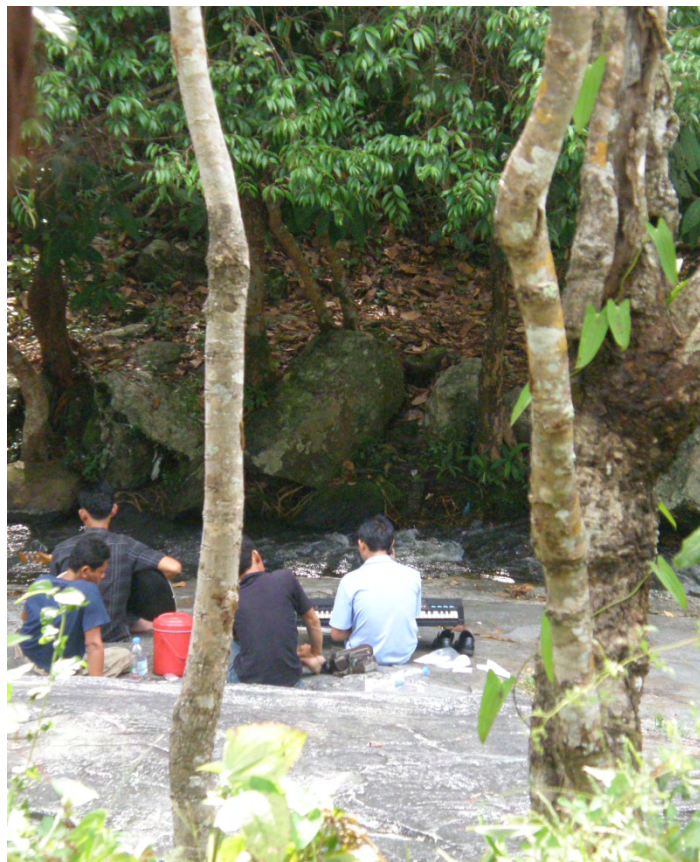
ภาพที่ 12 ผู้มาเยือนขณะประกอบกิจกรรมบริเวณน้ำตกวังบัวบาน