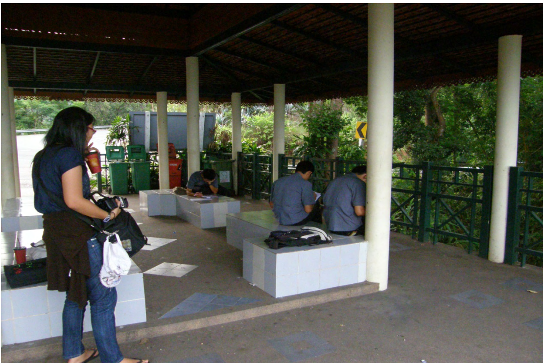
ภาพที่ 6 ผู้มาเยือนขณะตอบแบบสอบถามบริเวณจุดชมวิว