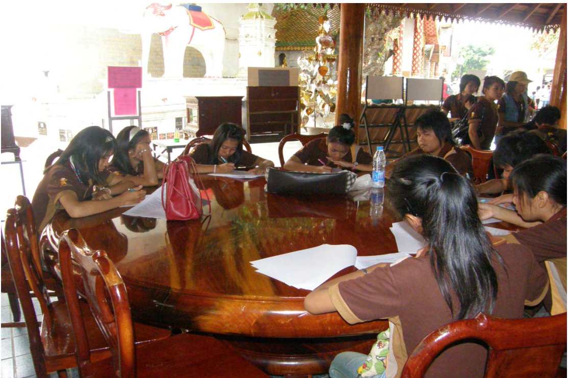
ภาพที่ 8 ผู้มาเยือนขณะตอบแบบสอบถามบริเวณวัดพระธาตุดอยสุเทพ