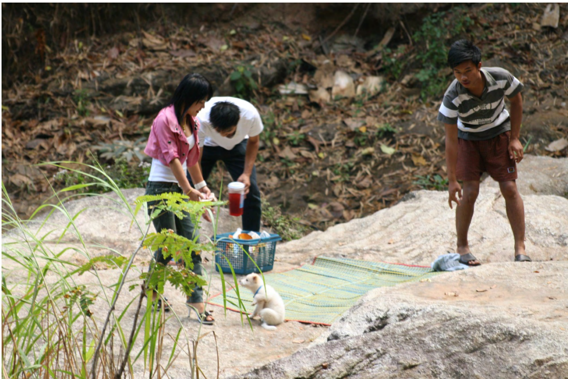
ภาพที่ 10 ผู้มาเยือนนำสัตว์เลี้ยงเข้ามาในพื้นที่อุทยานแห่งชาติดอยสุเทพ – ปุย