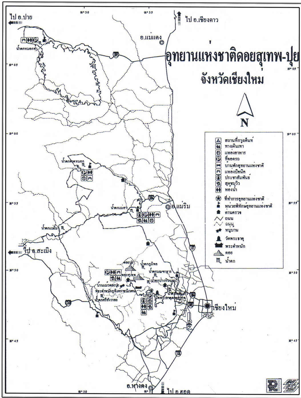
ภาพที่ 3 ที่ตั้ง และอาณาเขตติดต่อของอุทยานแห่งชาติดอยสุเทพ-ปุย