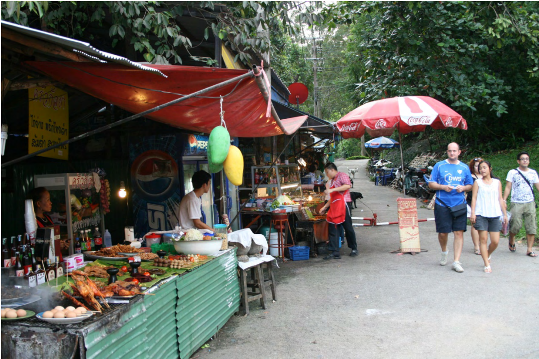
ภาพที่ 5 ร้านค้าบริเวณทางเข้าน้ำตกห้วยแก้ว