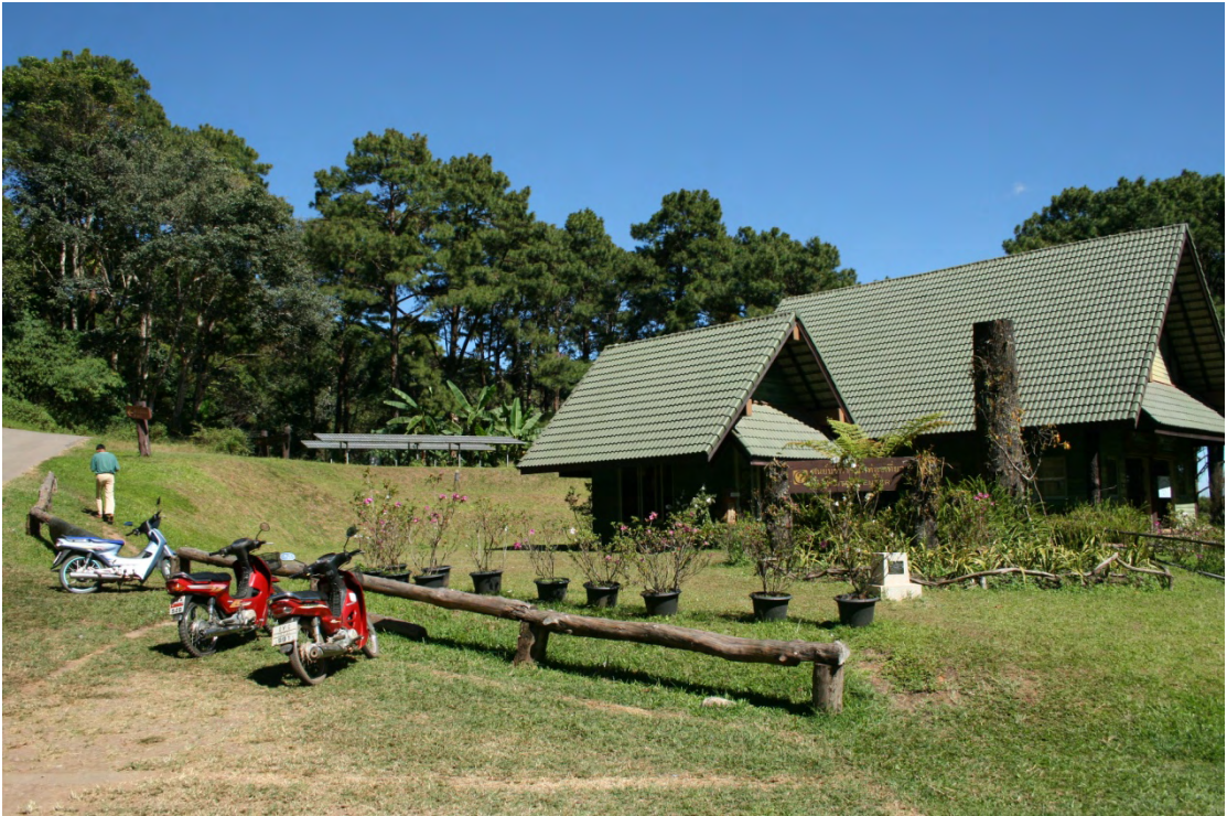
ภาพที่ 1 ลานกางเต็นท์ยอดดอยนุ้ย