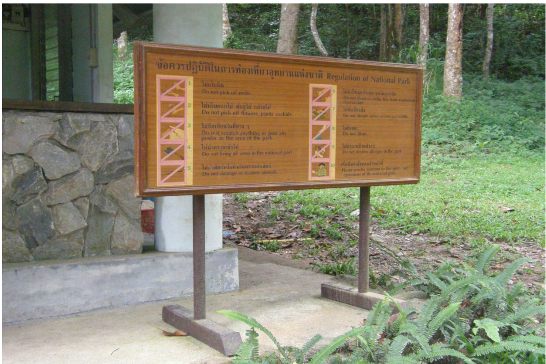
ภาพที่ 4 ป้ายแสดงข้อควรปฏิบัติในการท่องเที่ยวอุทยานแห่งชาติบริเวณน้ำตกลมณฑาธาร