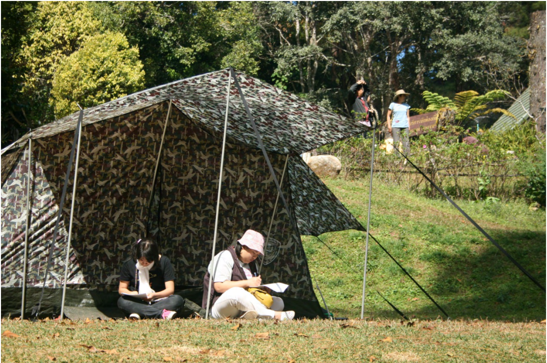
ภาพที่ 7 ผู้มาเยือนขณะตอบแบบสอบถามบริเวณลานกางเต็นท์ยอดดอยปุย