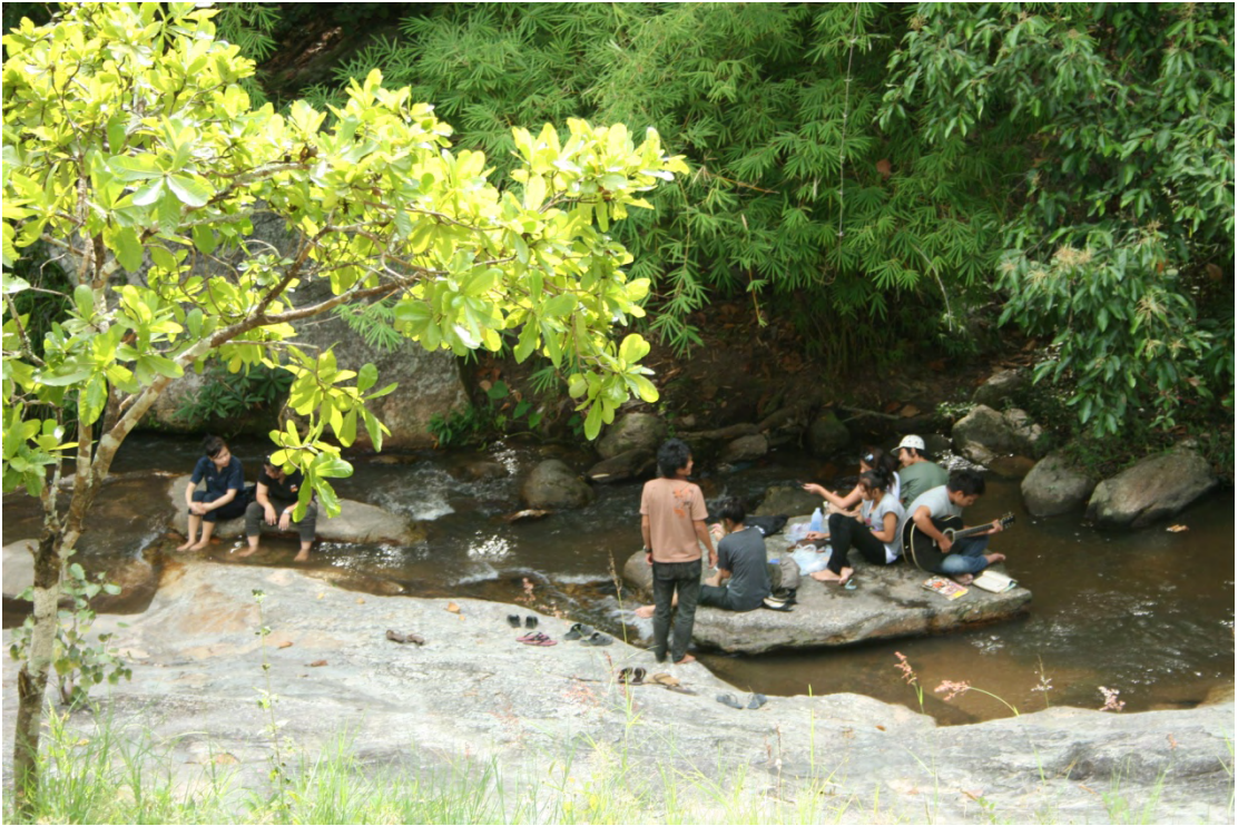
ภาพที่ 11 ผู้มาเยือนขณะประกอบกิจกรรมนันทนาการบริเวณน้ำตกวังบัวบาน