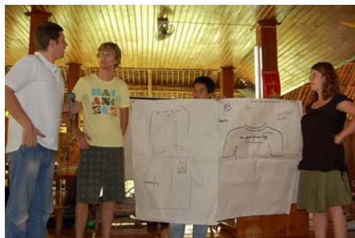
ภาพที่ 2 บรรยายการฝึกอบรมแบบมีส่วนร่วม หลักสูตร Marketing Access