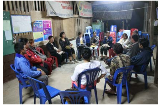
ภาพที่ 3 ภาพการฝึกอบรมมัคคุเทศก์มืออาชีพที่แม่กำปอง