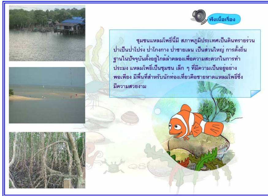
ภาพที่ 4.7 แสดงฉากที่ 6