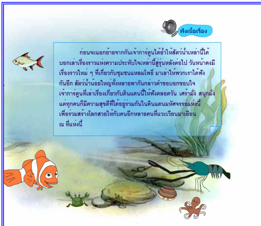
ภาพที่ 4.26 แสดงฉากที่ 25