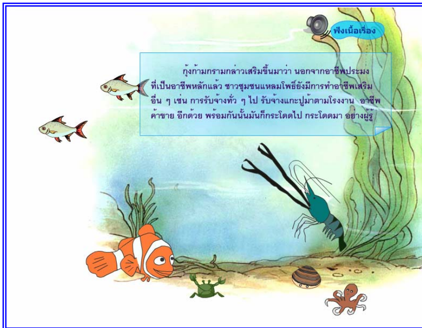
ภาพที่ 4.16 แสดงฉากที่ 15