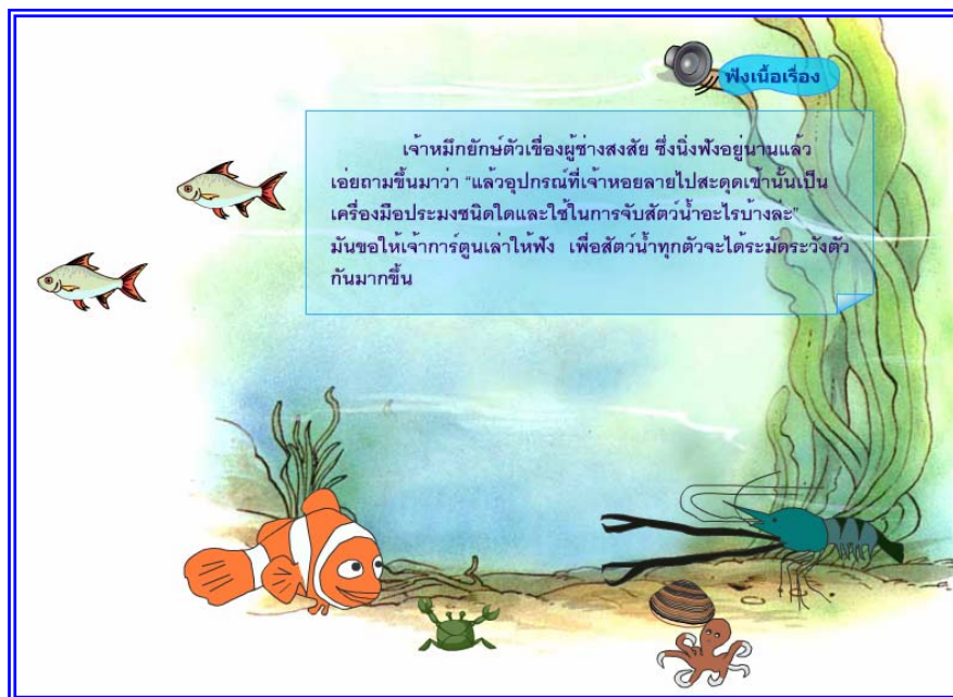
ภาพที่ 4.18 แสดงฉากที่ 17