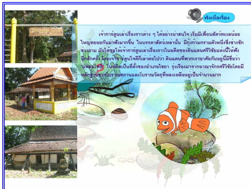
ภาพที่ 4.8 แสดงฉากที่ 7