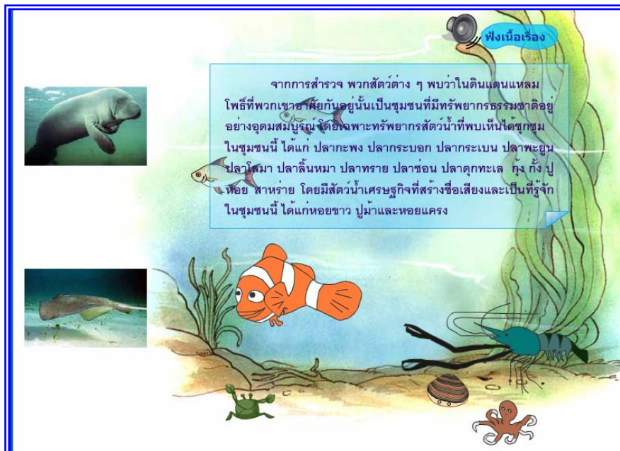
ภาพที่ 4.12 แสดงฉากที่ 11