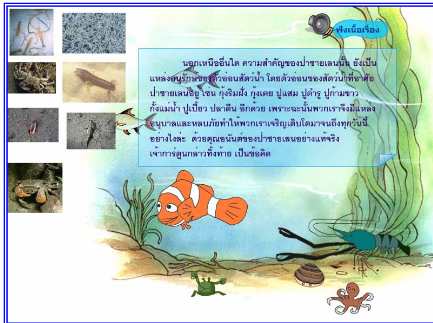
ภาพที่ 4.14 แสดงจากที่ 13