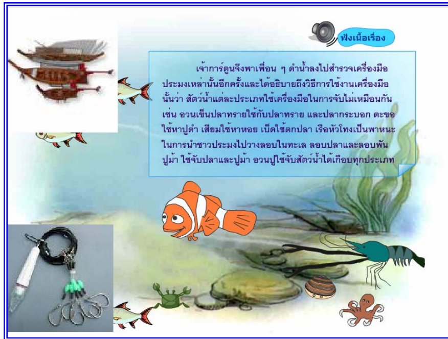
ภาพที่ 4.19 แสดงฉากที่ 18