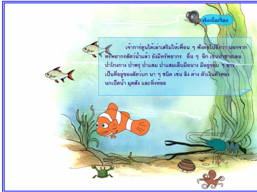
ภาพที่ 4.13 แสดงจากที่ 12