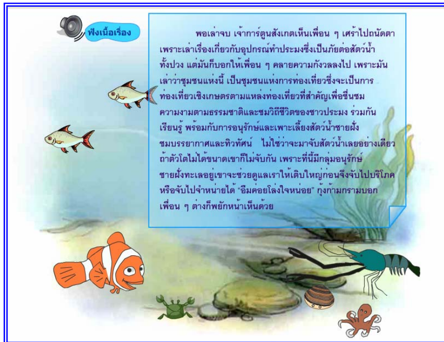
ภาพที่ 4.20 แสดงฉากที่ 19