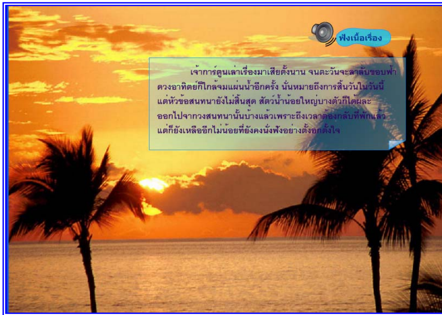
ภาพที่ 4.23 แสดงฉากที่ 22