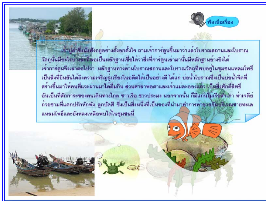
ภาพที่ 4.10 แสดงฉากที่ 9