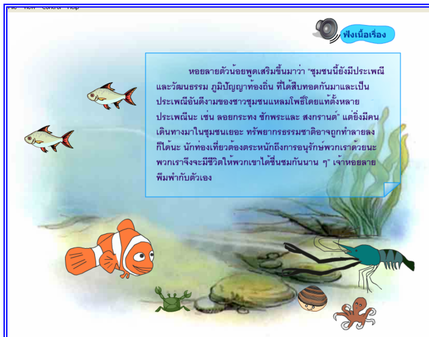
ภาพที่ 4.22 แสดงฉากที่ 21