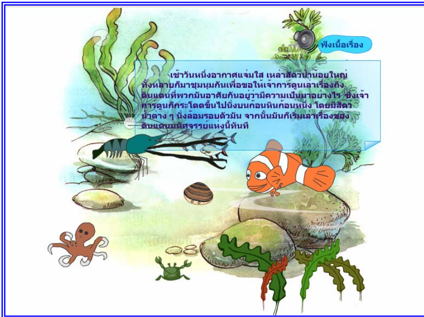
ภาพที่ 4.4 แสดงฉากที่ 3