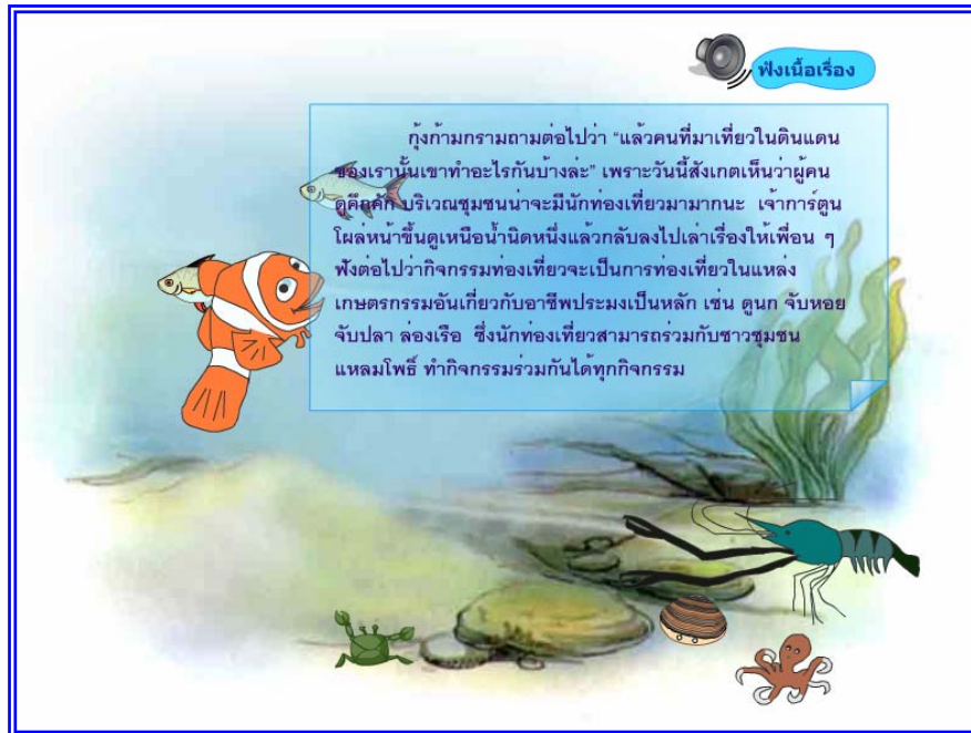
ภาพที่ 4.21 แสดงฉากที่ 20