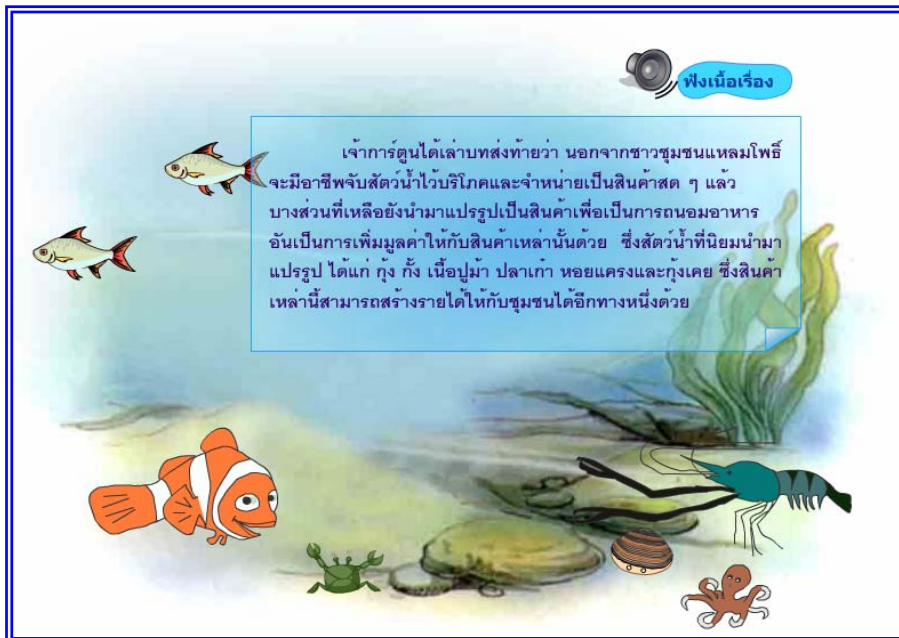
ภาพที่ 4.24 แสดงฉากที่ 23