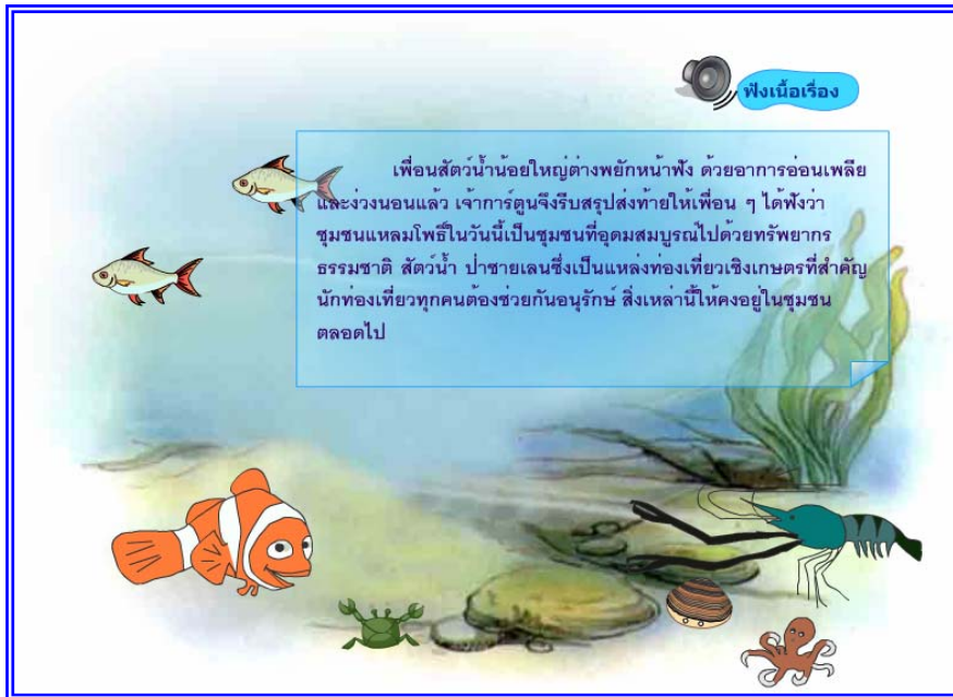
ภาพที่ 4.25 แสดงฉากที่ 24