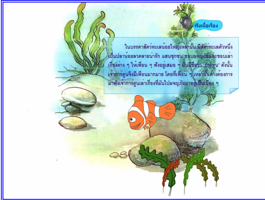
ภาพที่ 4.3 แสดงฉากที่ 2