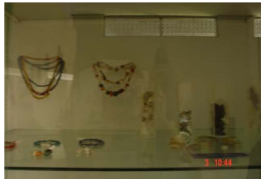
ภาพที่ 2.1 ลูกปัดที่ขุดพบที่บ้านพุมเรียง อำเภอไชยา