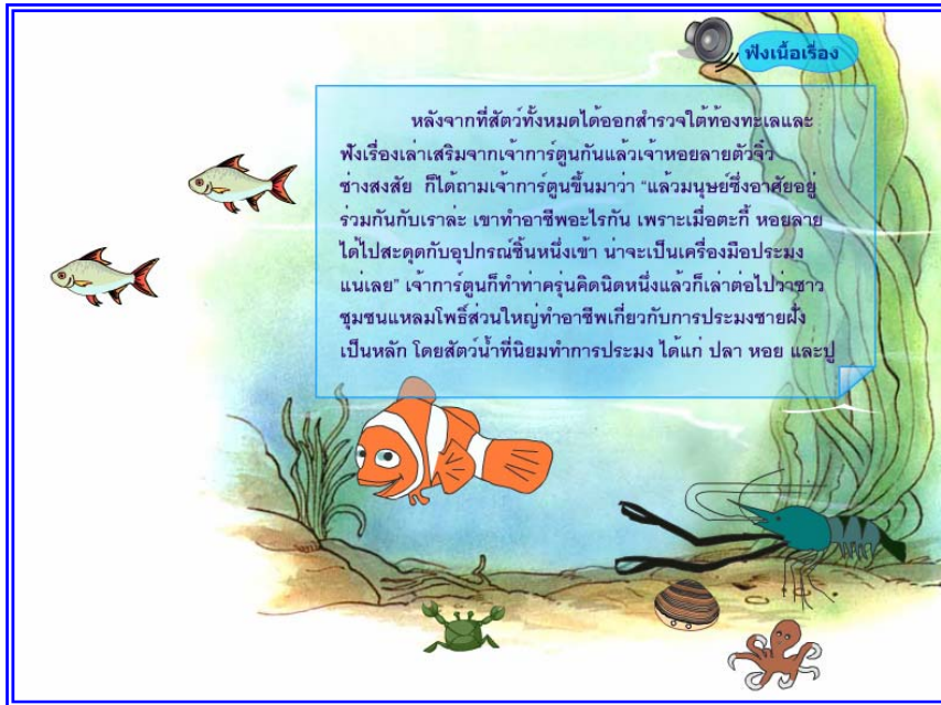
ภาพที่ 4.15 แสดงฉากที่ 14