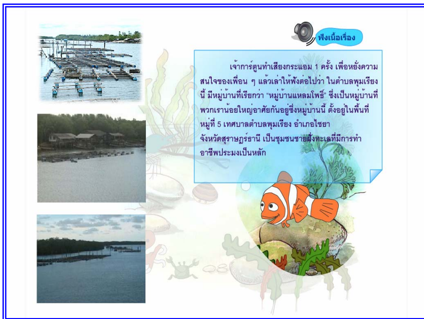
ภาพที่ 4.6 แสดงฉากที่ 5