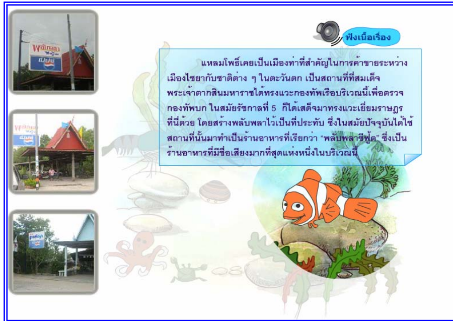
ภาพที่ 4.9 แสดงฉากที่ 8