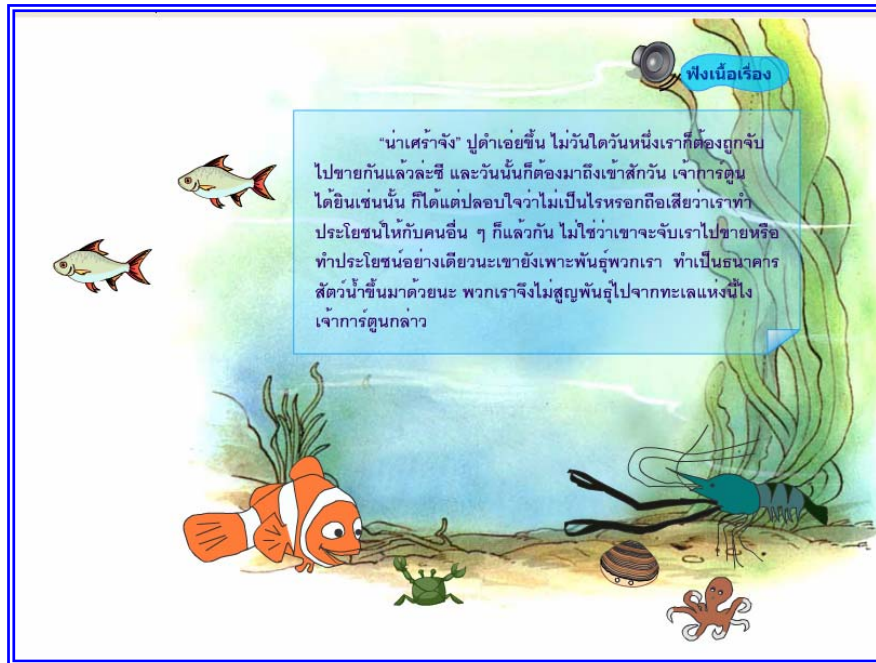
ภาพที่ 4.17 แสดงฉากที่ 16