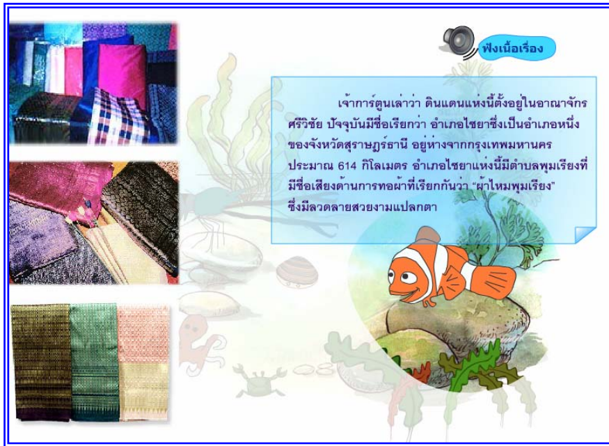
ภาพที่ 4.5 แสดงฉากที่ 4