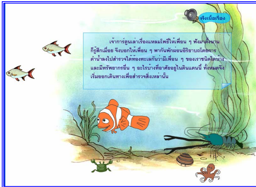
ภาพที่ 4.11 แสดงฉากที่ 10